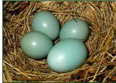
Гнездо соловья-красношейки с яйцом кукушки

К настоящему времени насчитывается около 150 видов птиц, которым кукушка подбрасывает свои яйца в гнездо. И что интересно, в гнезде вида-воспитателя яйцо кукушки практически неотличимо от яиц хозяев гнезда. Не выделяется окраской скорлупы, формой, а нередко также и размерами!