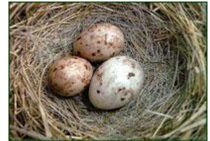
Гнездо овсянки-крошки с яйцом кукушки