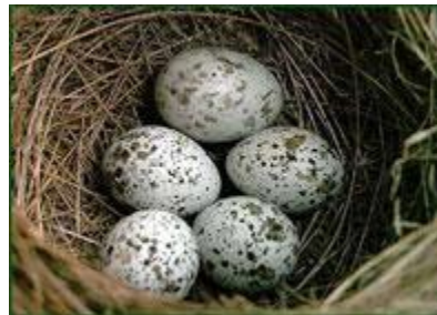
Гнездо дроздовидной камышовки с яйцом кукушки на заднем плане