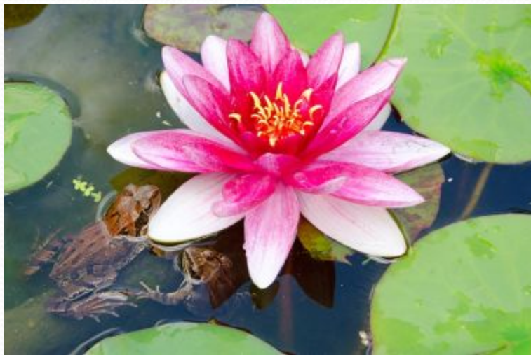
ЛИЛИИ (кувшинки) БОЛОТНЫЕ

В народной медицине ряску используют как жаропонижающее, противоаллергическое, общеукрепляющее, вяжущее, противовоспалительное, желчегонное, мочегонное и антимикробное средство.