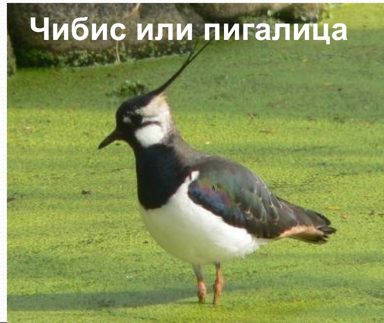
Чибис или пигалица