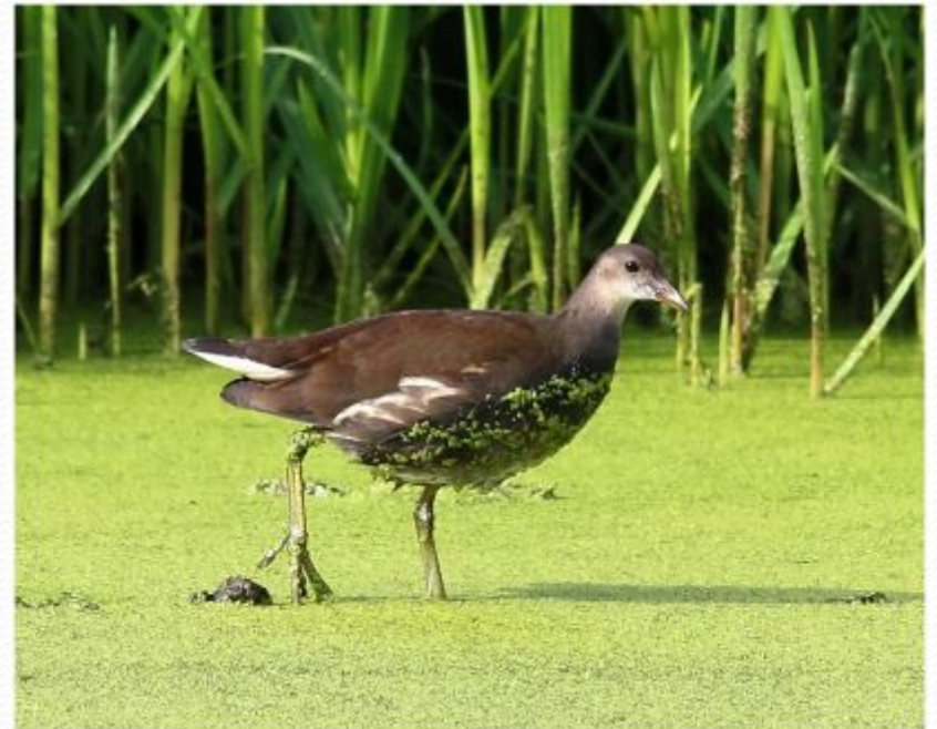
Лысуха или болотная курочка