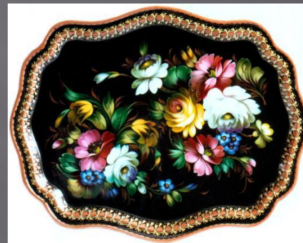
Букет в раскидку