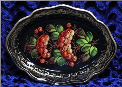
Ветка с угла