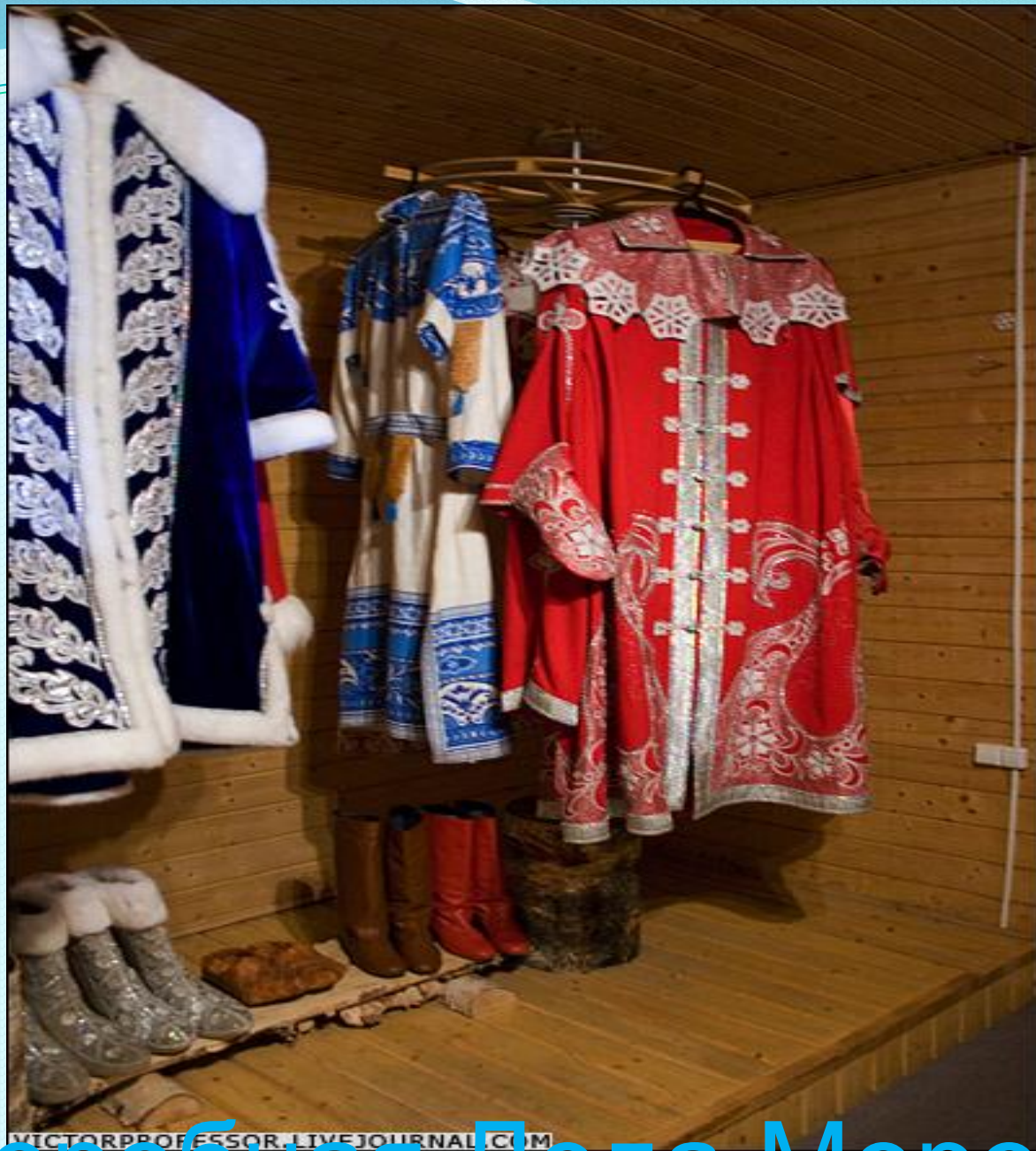
Гардеробная Деда Мороза