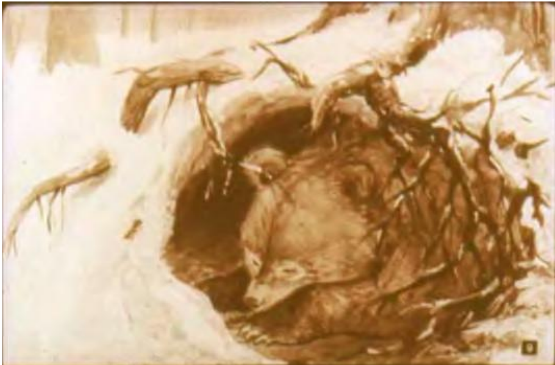
Под корягой в буреломе Спит медведь в уютном доме.