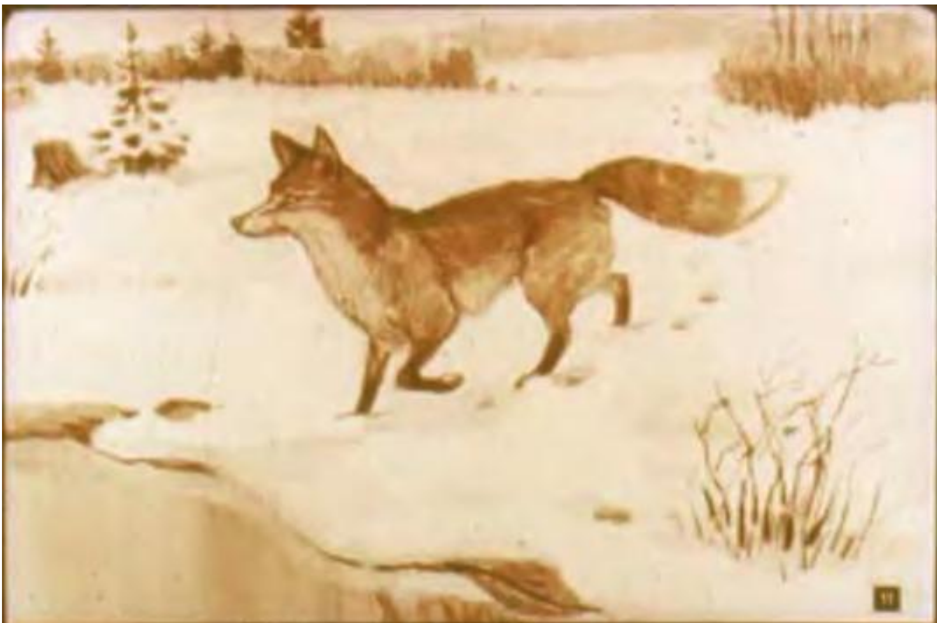
Осторожная лисица Подошла к ручью напиться.