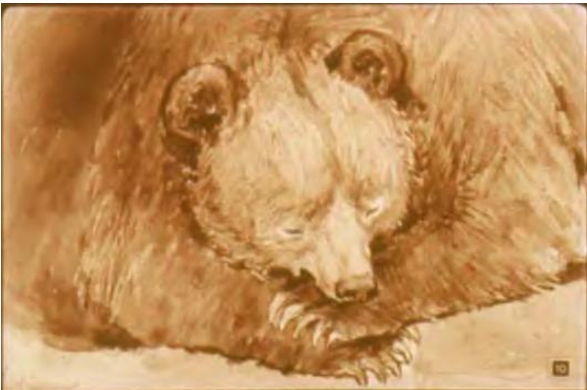
Положил он лапу в рот И, как маленький, сосёт.