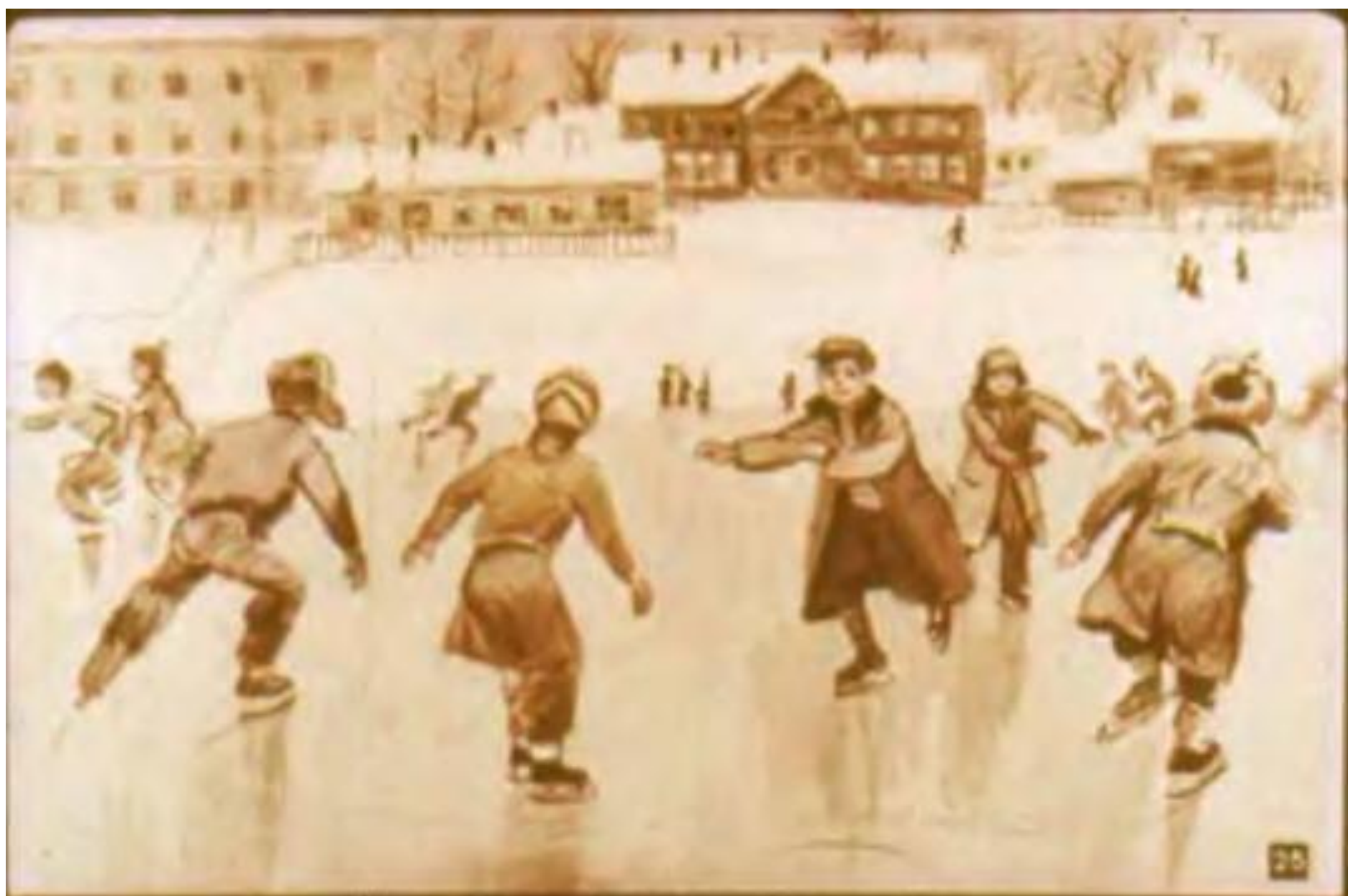
На пруду наток хороший, Лед сверкает, как стекло.