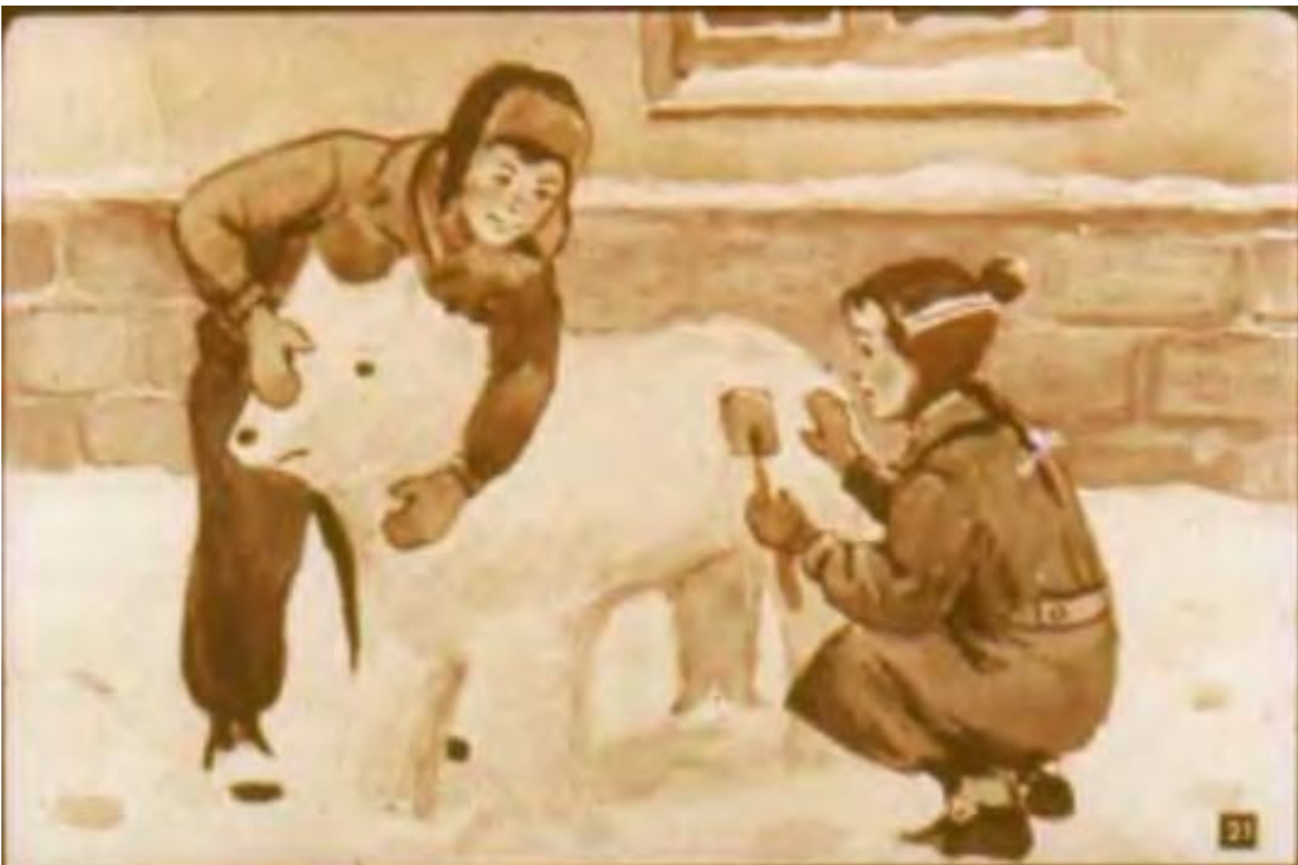
Под окном Тамара с Федей Лепят белого медведя.