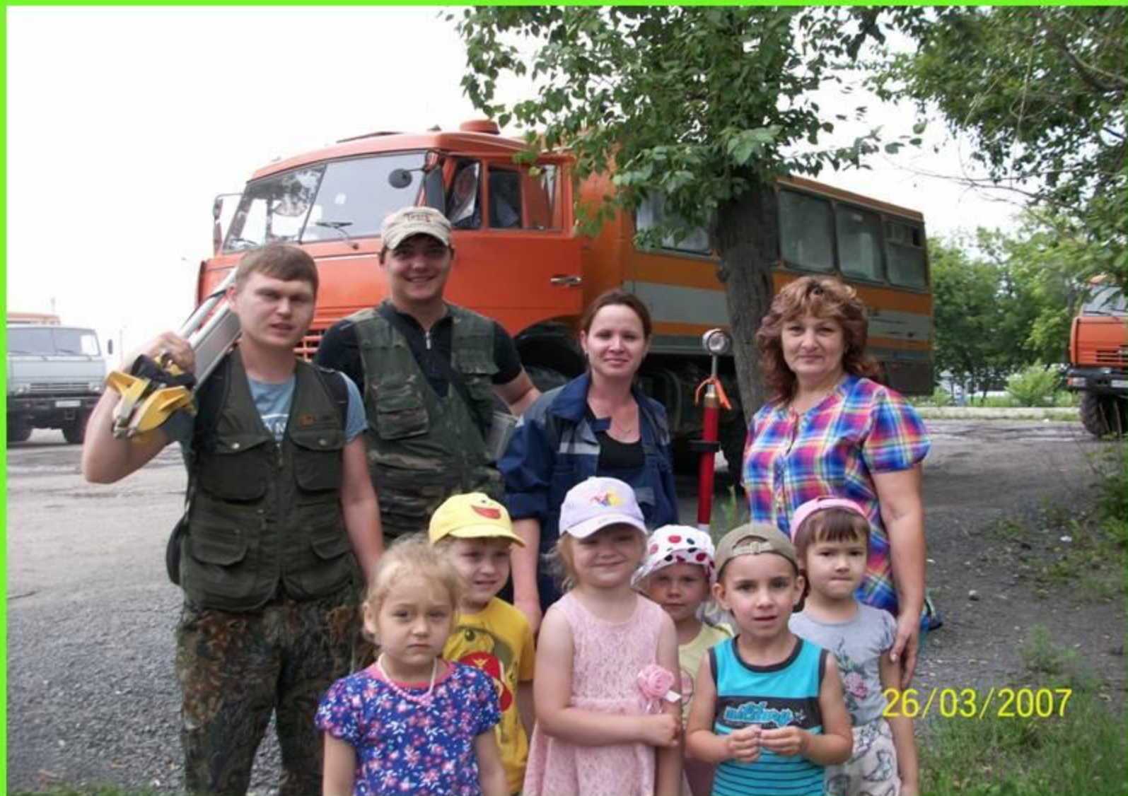
Знакомим детей с работниками угольного разреза.