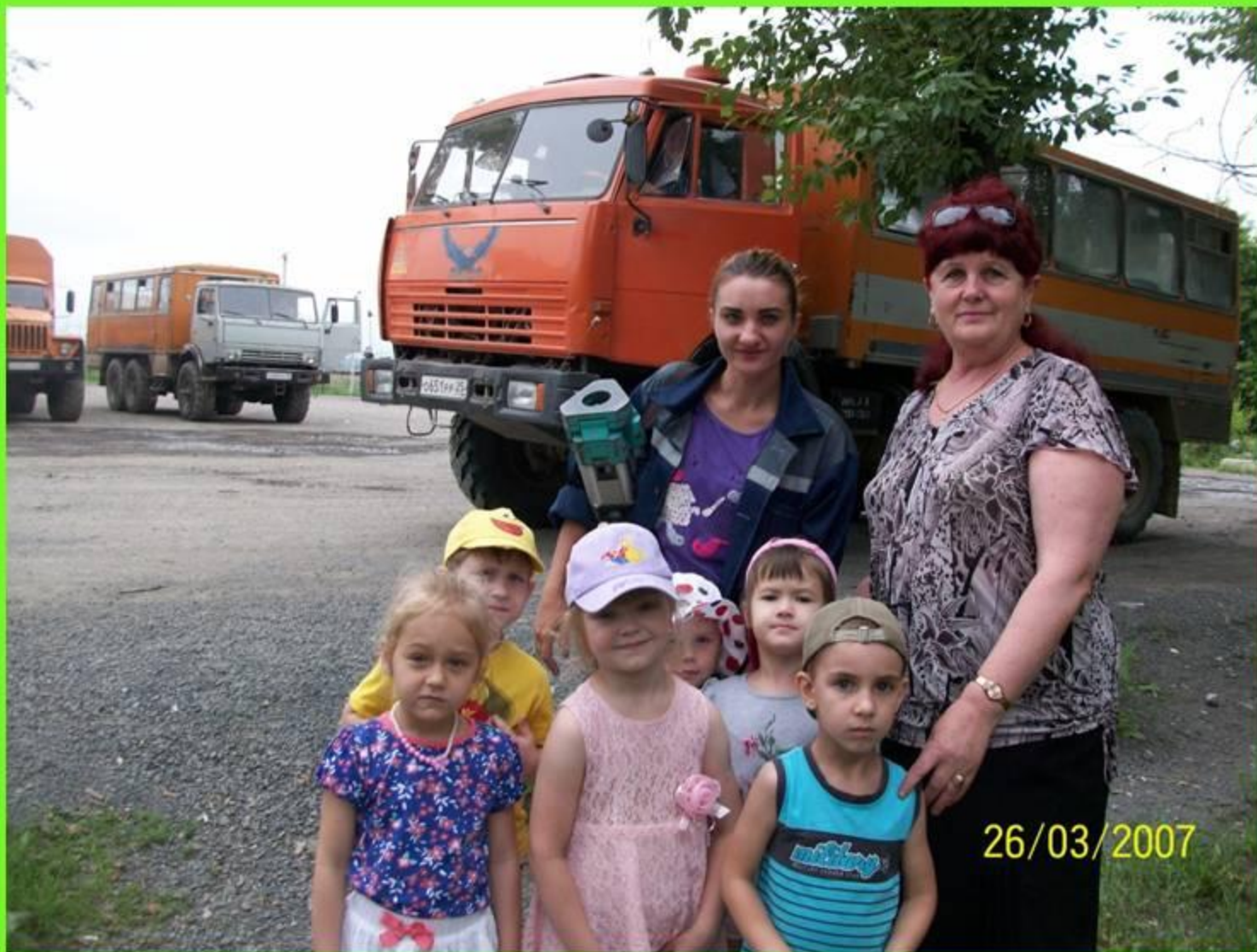
Знакомимся с профессией маркшедера.