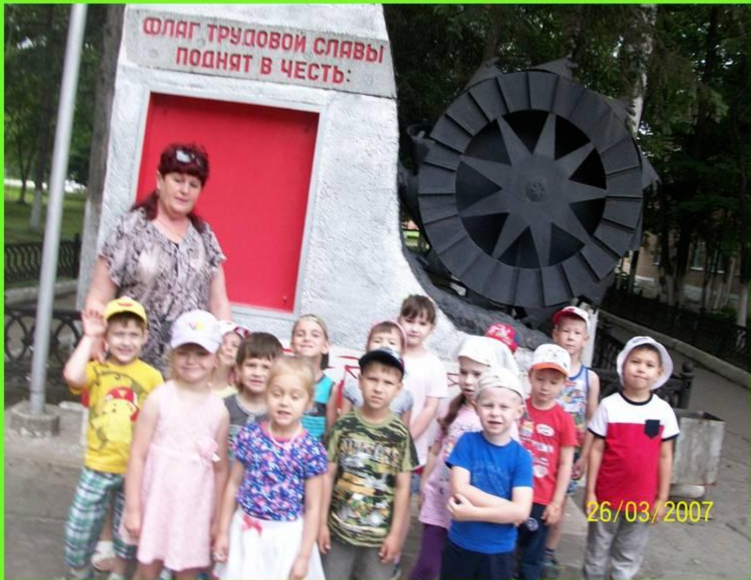
Стелла поднятия флага за хорошо выполненную работу шахтеров.