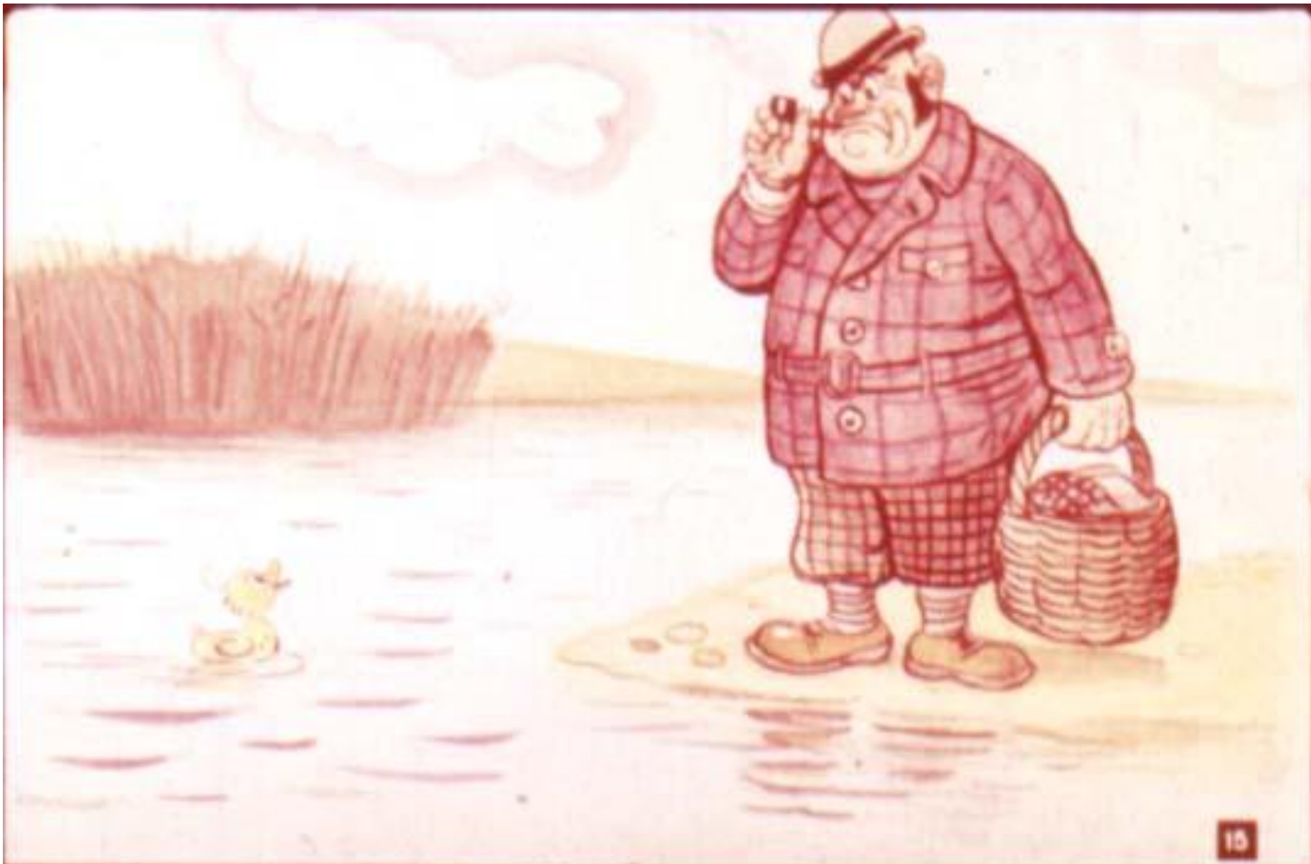
и поплыл к берегу. На берегу он увидел незнакомого человека с корзинкой.