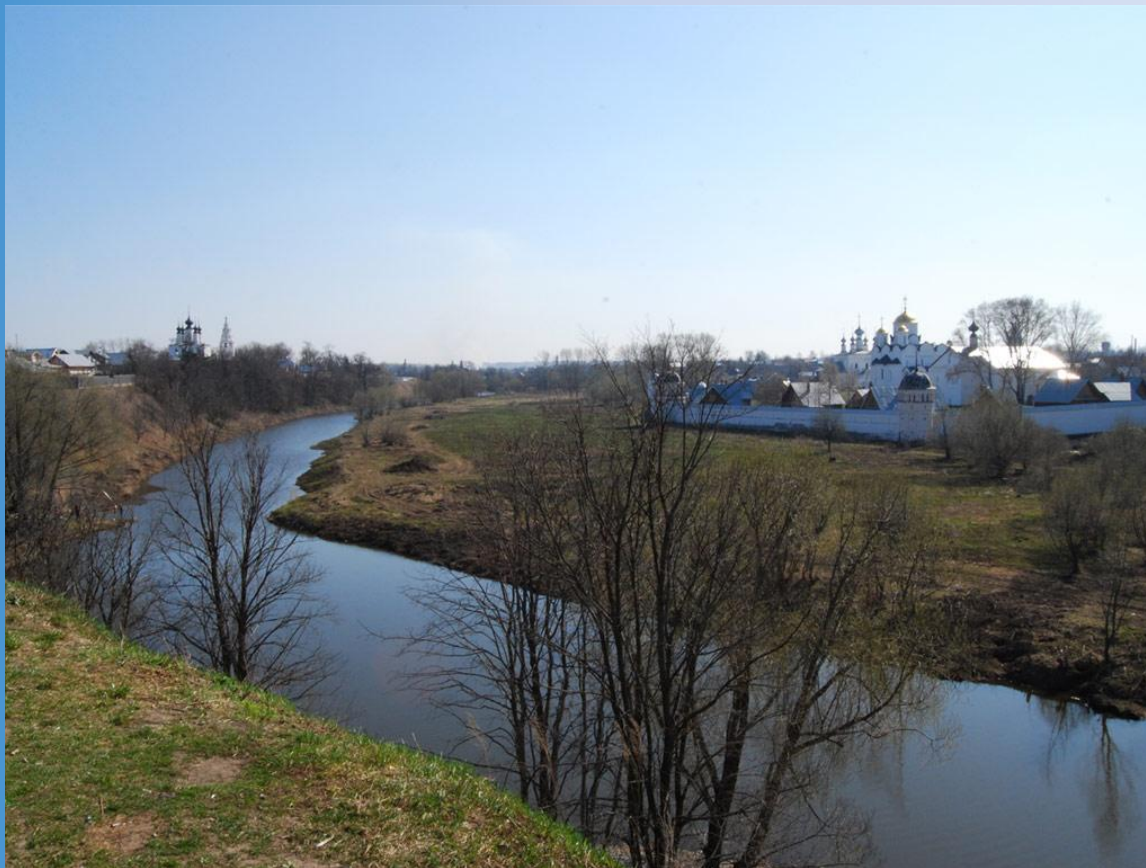
Река Каменка на которой расположен г. Суздаль