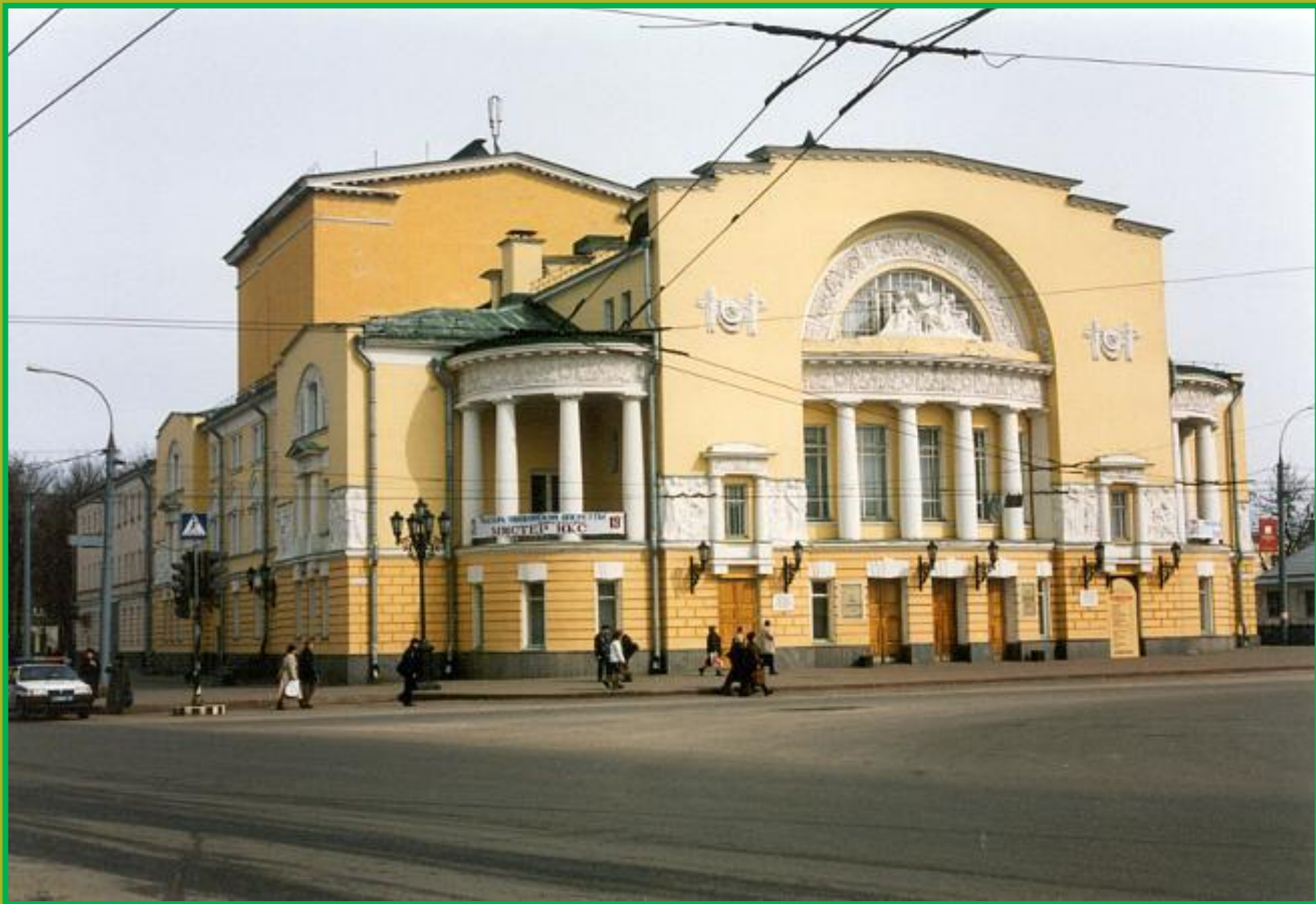
Театр им. Волкова