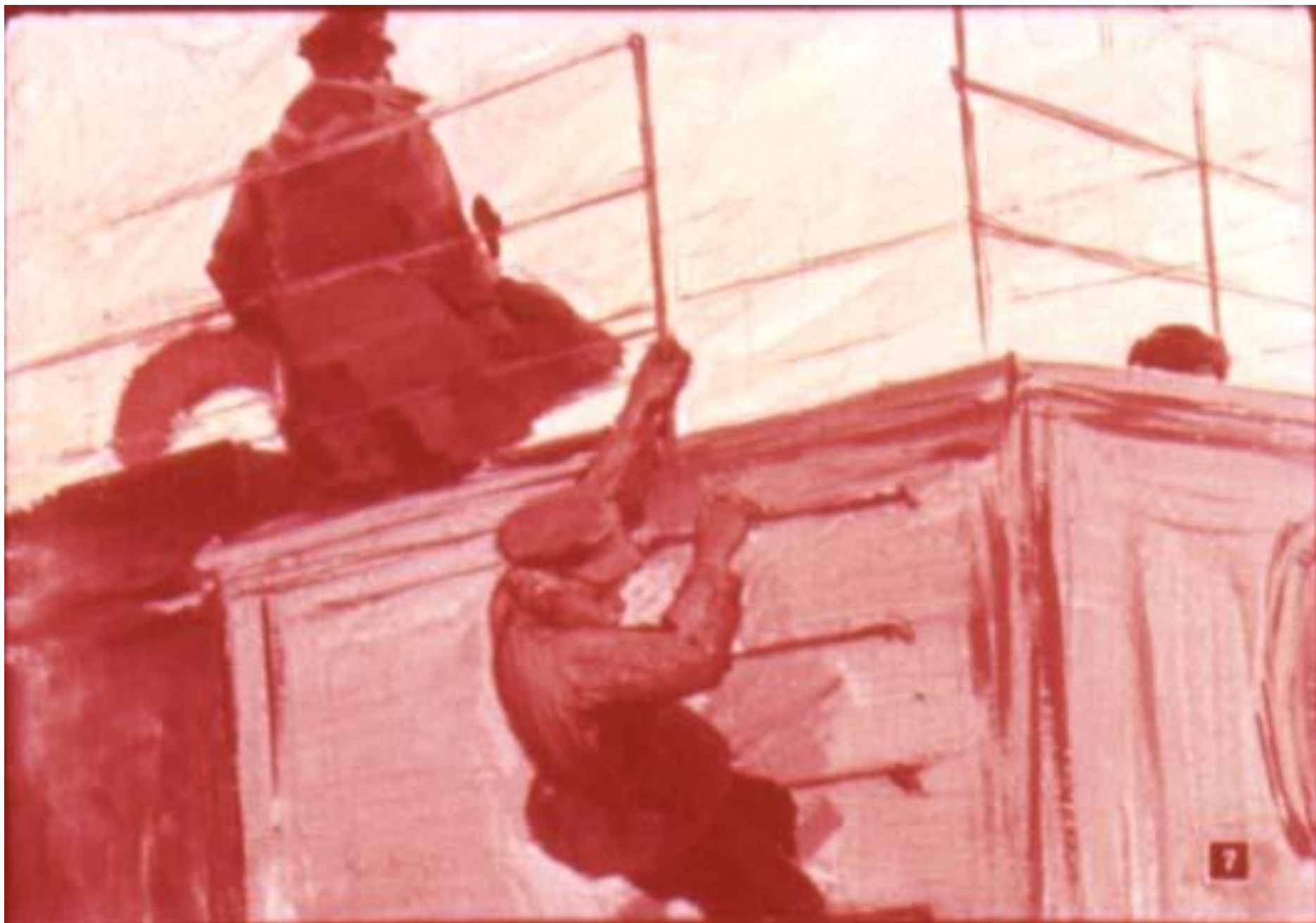
Петьна обиделся и полез в кубрик.