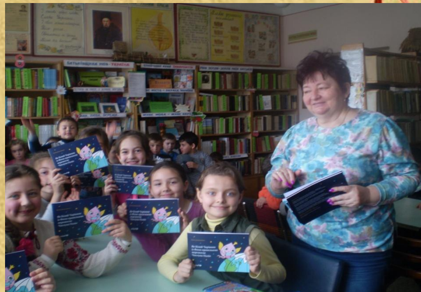
Подорожуємо країною казок (Літературна гра) 06.10.2016