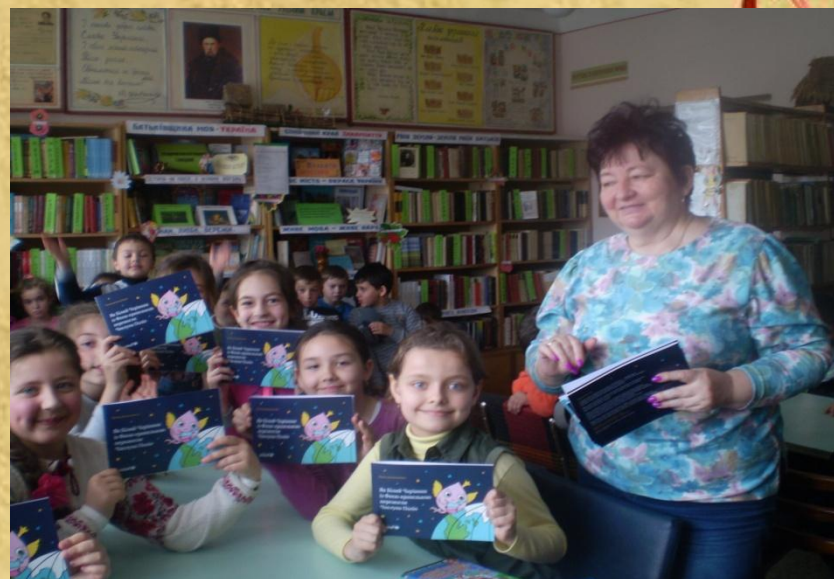
Подорожуємо країною казок (Літературна гра) 06.10.2016