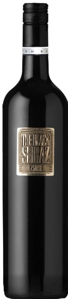
БЕРТОН Метал Лейбл Блэк Шираз кр. сух.

METAL LABEL (букв. «металлическая этикетка»). Знаковые вина стильного оформления от Berton Vineyard. Виноград для этих вин растет в регионах Limestone Coast и Big Rivers (Южная и Центральная винодельческие зоны Австралии). Вина Metal Label отличаются интенсивным цветом, ярким сложным букетом и сильным характерным вкусом