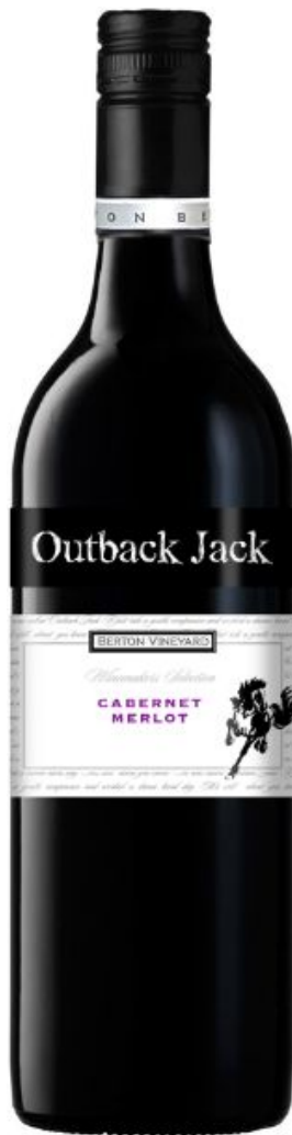
Каберне- Мерло кр. сух.