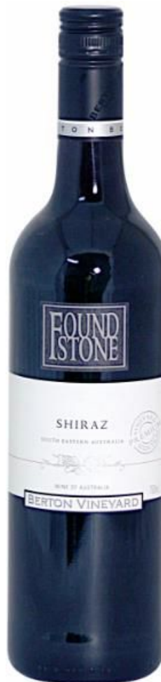
БЕРТОН Фаундстоун Шираз кр. сух.

FOUNDSTONE (букв. «найденный камень») – именно под этим названием Berton Vineyard выпустил свои первые вина. В силу этого факта, данное название и сами вина – гордость для компании, которая дорожит этой маркой и вина которой олицетворяют в целом стиль продукции Berton.