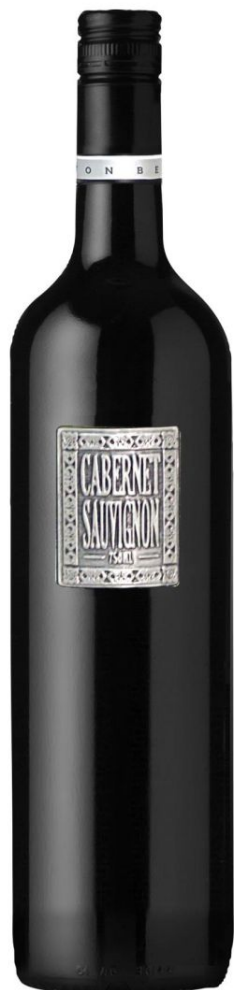
БЕРТОН Метал Лейбл Каберне Совиньон кр. сух.