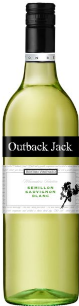
Семильон- Совиньон бел. сух.