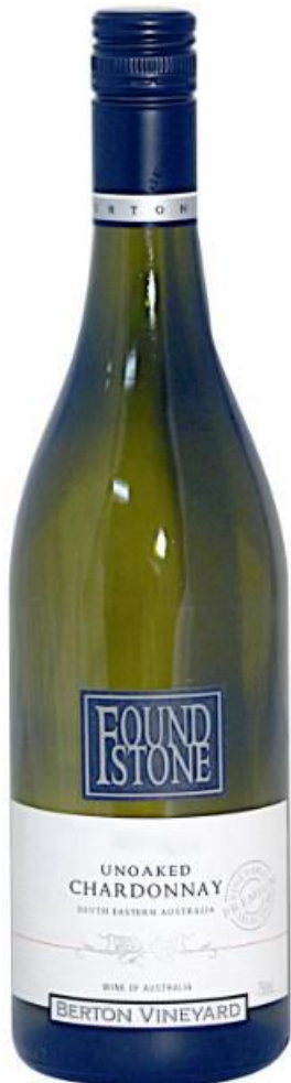
БЕРТОН Фаундстоун Анокд Шардоне бел. сух.