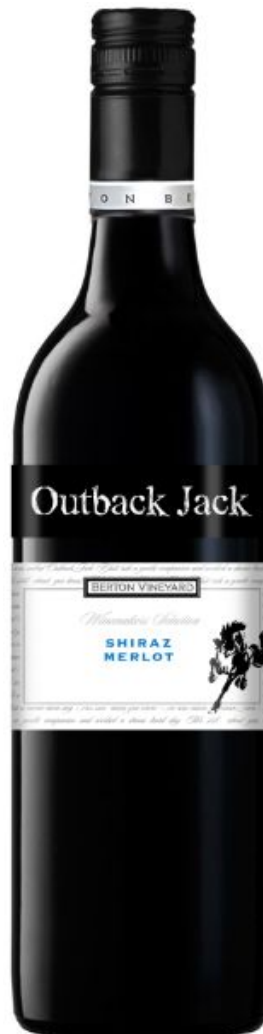
Шираз- Мерло кр. сух.

OUTBACK JACK (букв. «парень/работяга из сельской местности»). Outback – так в Австралии называют малонаселенную сельскую местность, Jack – многозначное понятие (более 50 значений), означает как «парень», «работяга», так и «скакун», «жеребец» и др. Outback Jack - так еще в Австралии называют племенных лошадей (жеребцов), которые используются для загона скота на пастбища или в стойла . Outback Jack это кроме того прозвище легендарного профессионального рестлера из Австралии в конце 90-х гг, и сеть популярных ресторанов Outback Jack Bar & Grill