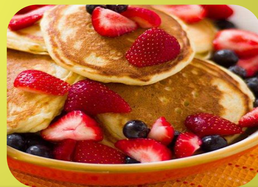
Оладьи на кефире копченым лососем и икрой