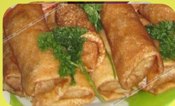
Гр Блинчики с мясом припеком