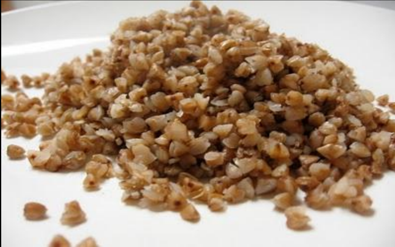
Каша гречневая рассыпчатая