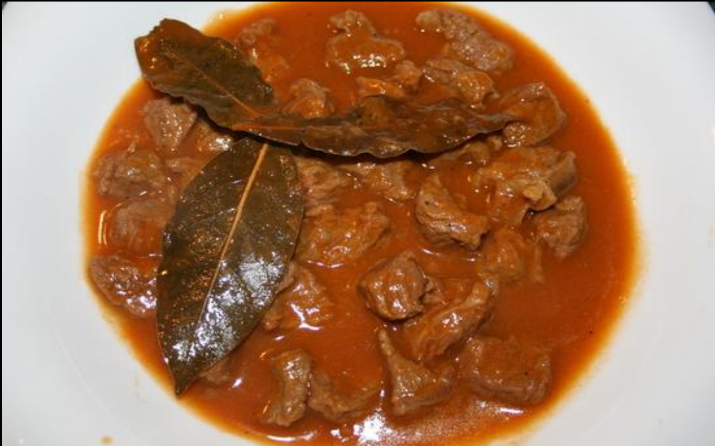
Гуляш из говядины