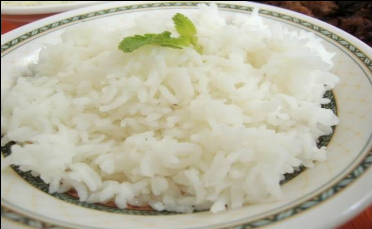
Каша рисовая рассыпчатая