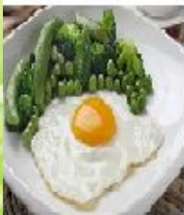
Яичница с гарниром