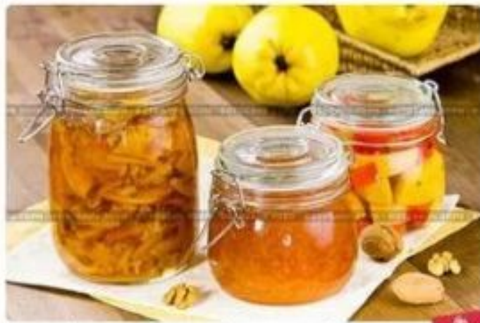
Варенье из айвы с орехами и лимонем, айвовое повидло и айва, мармелад

Қанттың жоғары концентрациясы кремдер, кондитерлік тағамдар дайындауға қолданылады. Қанттың мөлшері 60пайыз және одан да көп концентрациясы экзотоксин бөліп шығаратын патогенді стафилококктардың көбеюін тоқтатады.