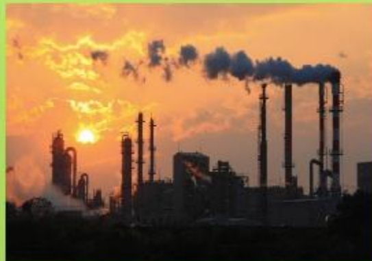
Дым заводов и фабрик