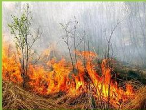
Горит прошлогодняя трава

3 основных источника загрязнения атмосферы: промышленность, бытовые котельные и транспорт.