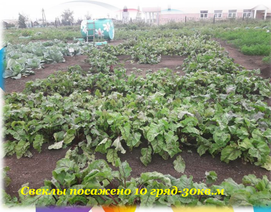
Свеклы посажено 10 гряд-30кв.м