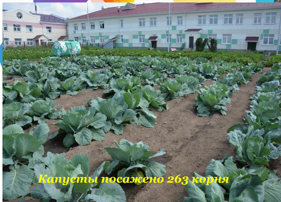
Капусты посажено 263 корня