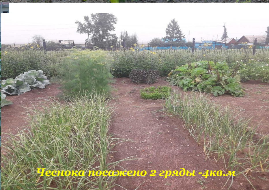
Чеснока посажено 2 гряды -4кв.м