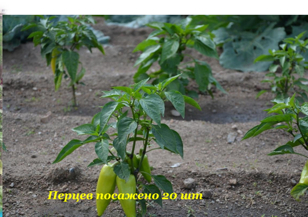
Перцев посажено 20 шт