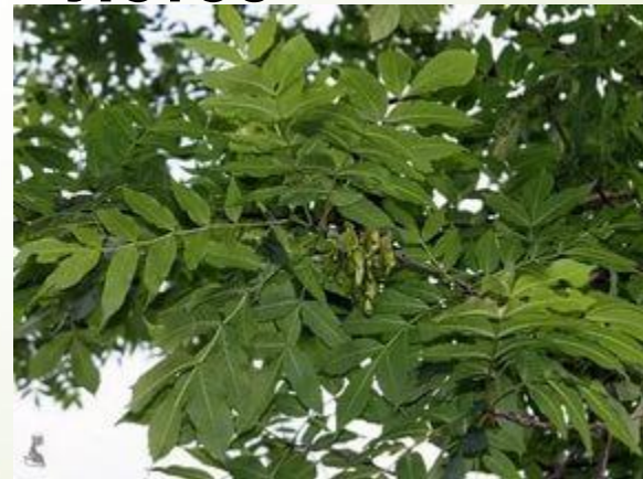
ясень маньчжурский (лотос)