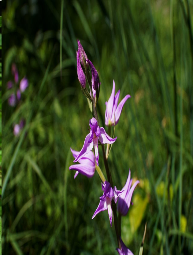
пыльцеголовник красный (венерин башмачок и пыльцеголовник красный )