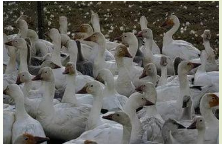
(колония белых гусей)