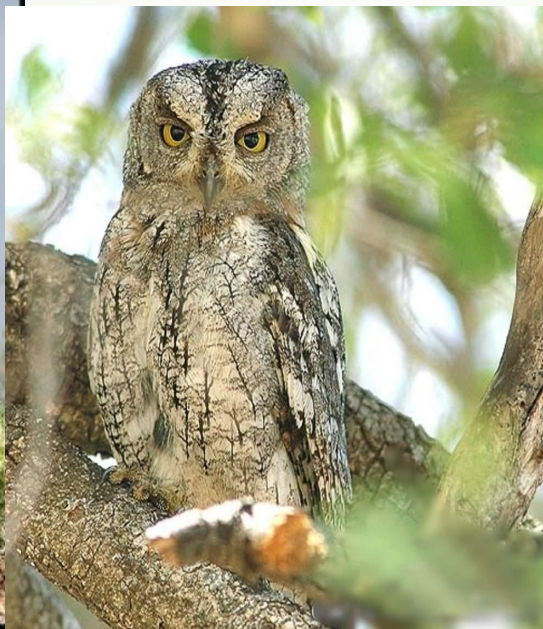
Сова – сплюшка