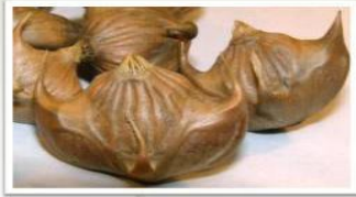
ЧИЛИМ (ВОДЯНОЙ ОРЕХ)