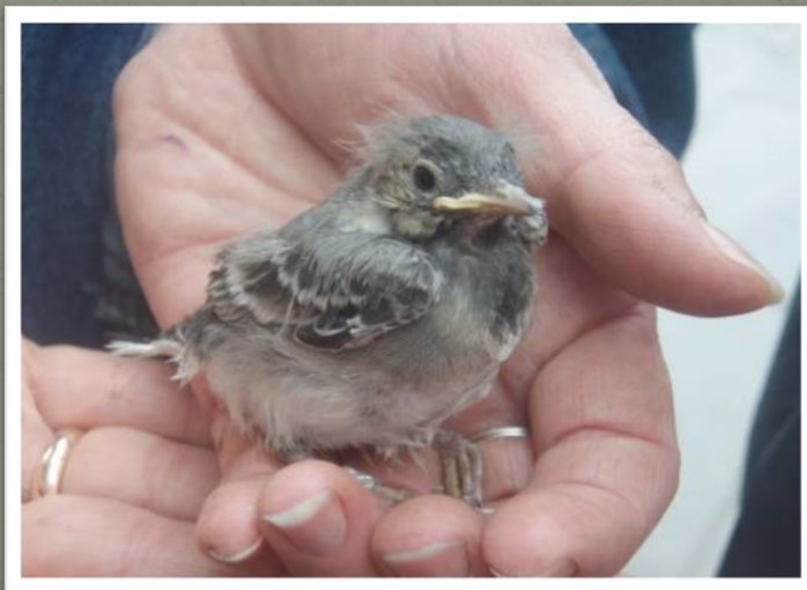
Слёток белой трясогузки

Если уж вы решили выкормить птенца, вам надо носить его на себе в мешочке, постоянно греть теплом собственного тела, и кормить пинцетом каждые 20 мин. А еда - это мягкие без волосков гусеницы, личинки жуков, кузнечики, мухи, мелкие пауки. Даже зерноядных птиц нужно выкармливать насекомыми.