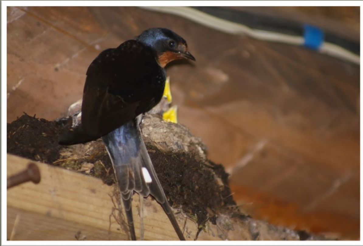
Деревенская ласточка с птенцами

Правила несложные, но они помогут птицам благополучно вырастить потомство и на будущий год они снова радовать вас своими звонкими песнями!