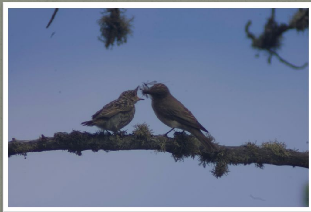
Серая мухоловка с птенцом

Родители отлично знают, где их птенчики находятся, и продолжают исправно приносить им корм.