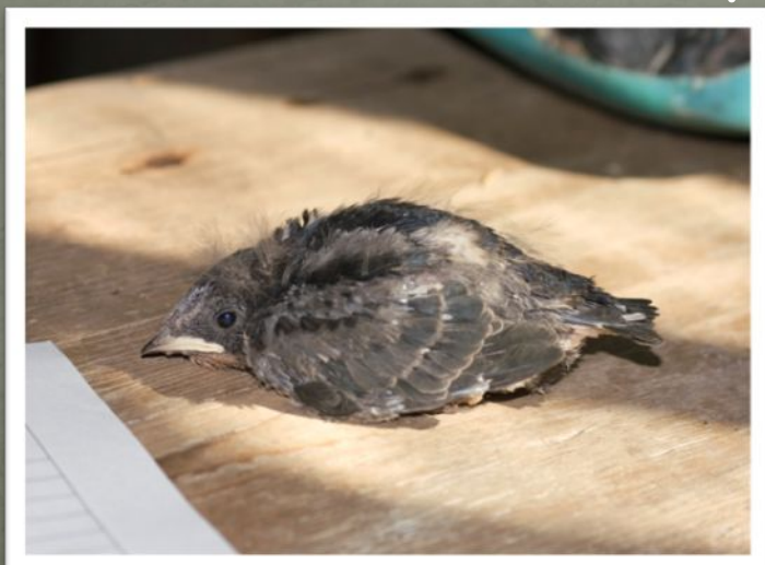
Птенец деревенской ласточки

При перегреве - они тяжело дышат с раскрытым клювом; при переохлаждении - вялость, состояние оцепенения, отказ от пищи, и если птенца вовремя не согреть, исход может быть смертельным.