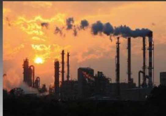
Дым заводов и фабрик