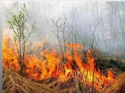
Горит прошлогодняя трава

3 основных источника загрязнения атмосферы: промышленность, бытовые котельные и транспорт.