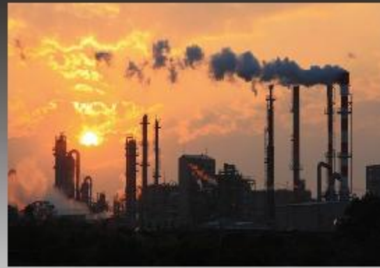
Дым заводов и фабрик