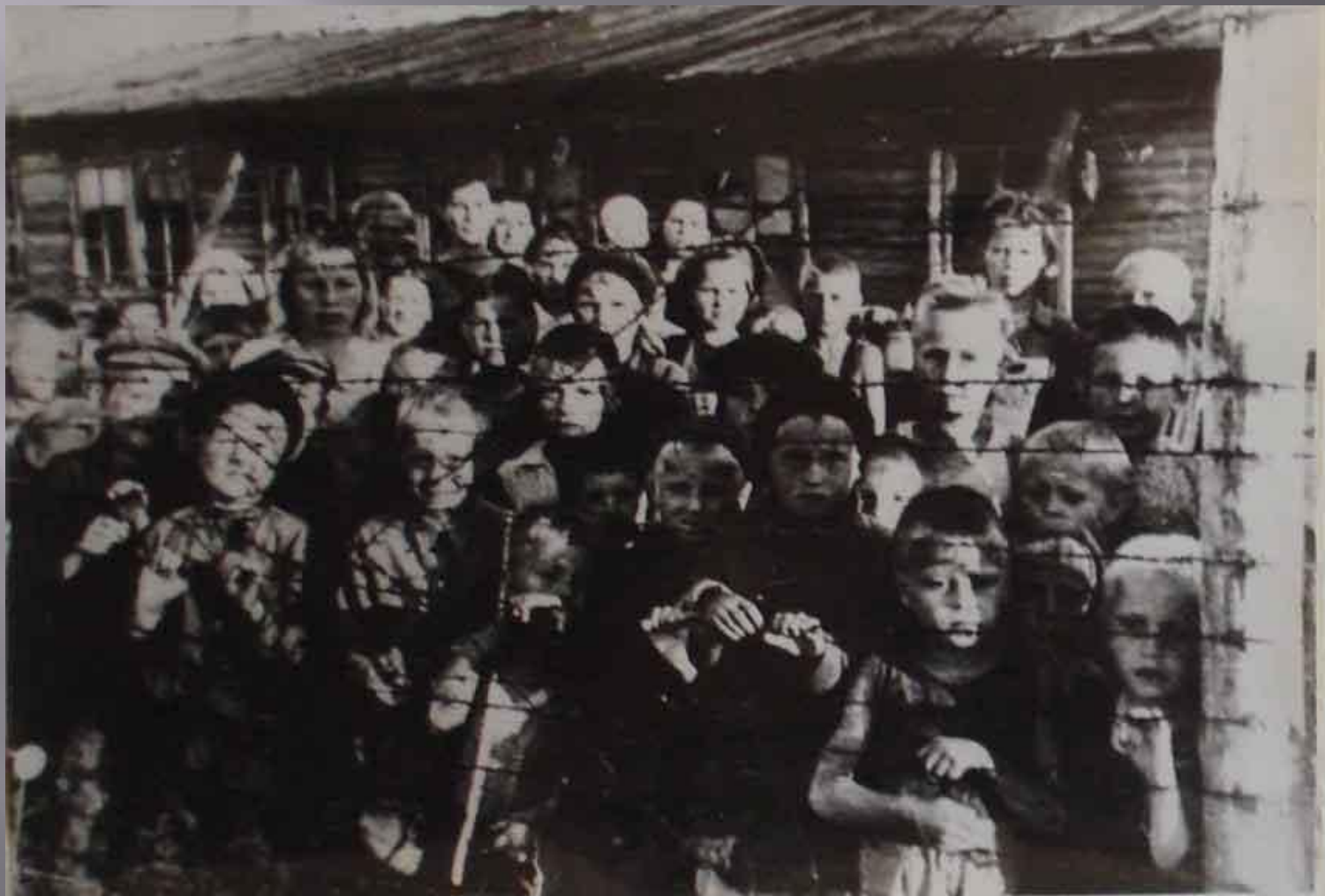
Дети-узники в концлагере г. Петрозаводска

Охрана лагеря каждый день выносила из детского барака в больших корзинах окоченевшие трупы погибших мучительной смертью детей. Они сжигались за оградой лагеря или сбрасывались в выгребные ямы и частично закапывались в лесу вблизи лагеря.