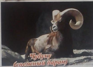
Чубуку (снежный баран)