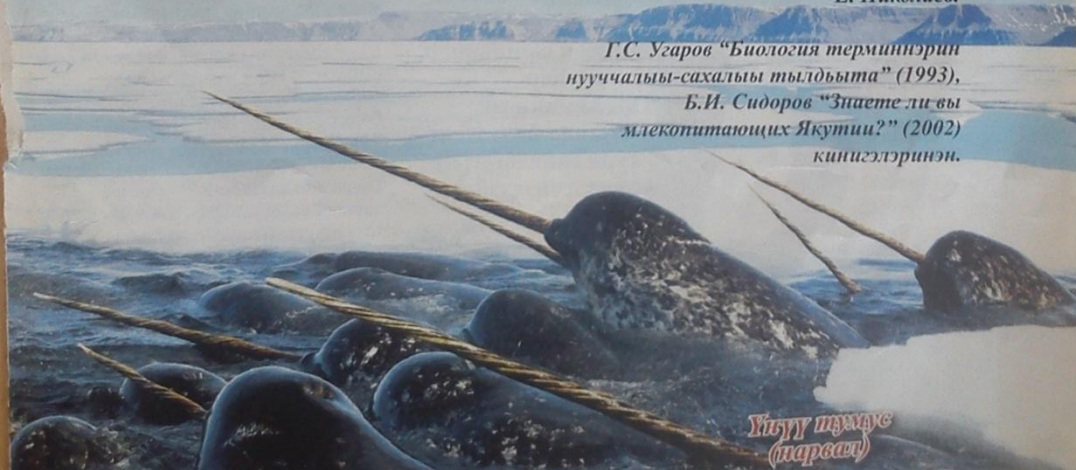
Үгүү туммас (морсат)

Б.И. Сидоров "Знаете ли вы млекопитающих Якутии?" (2002) книгэлэринэн.