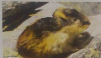
Чыгырсакаан, Амур чыгырыкаана (амурский лемминг)