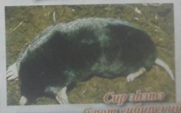
Сур эһитэ (зрэт сибирский)