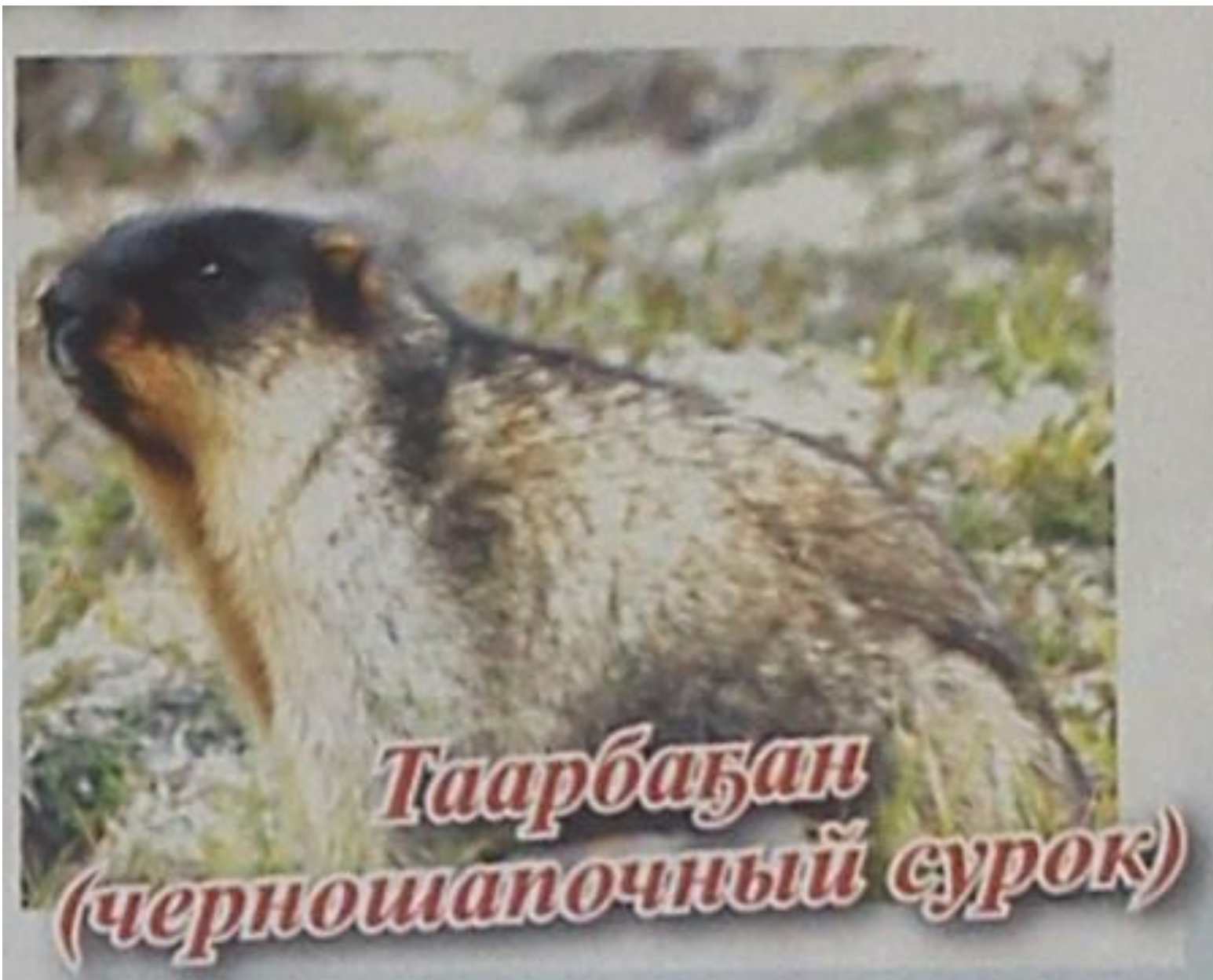
Таарбаʻан (черношапочный сурок)