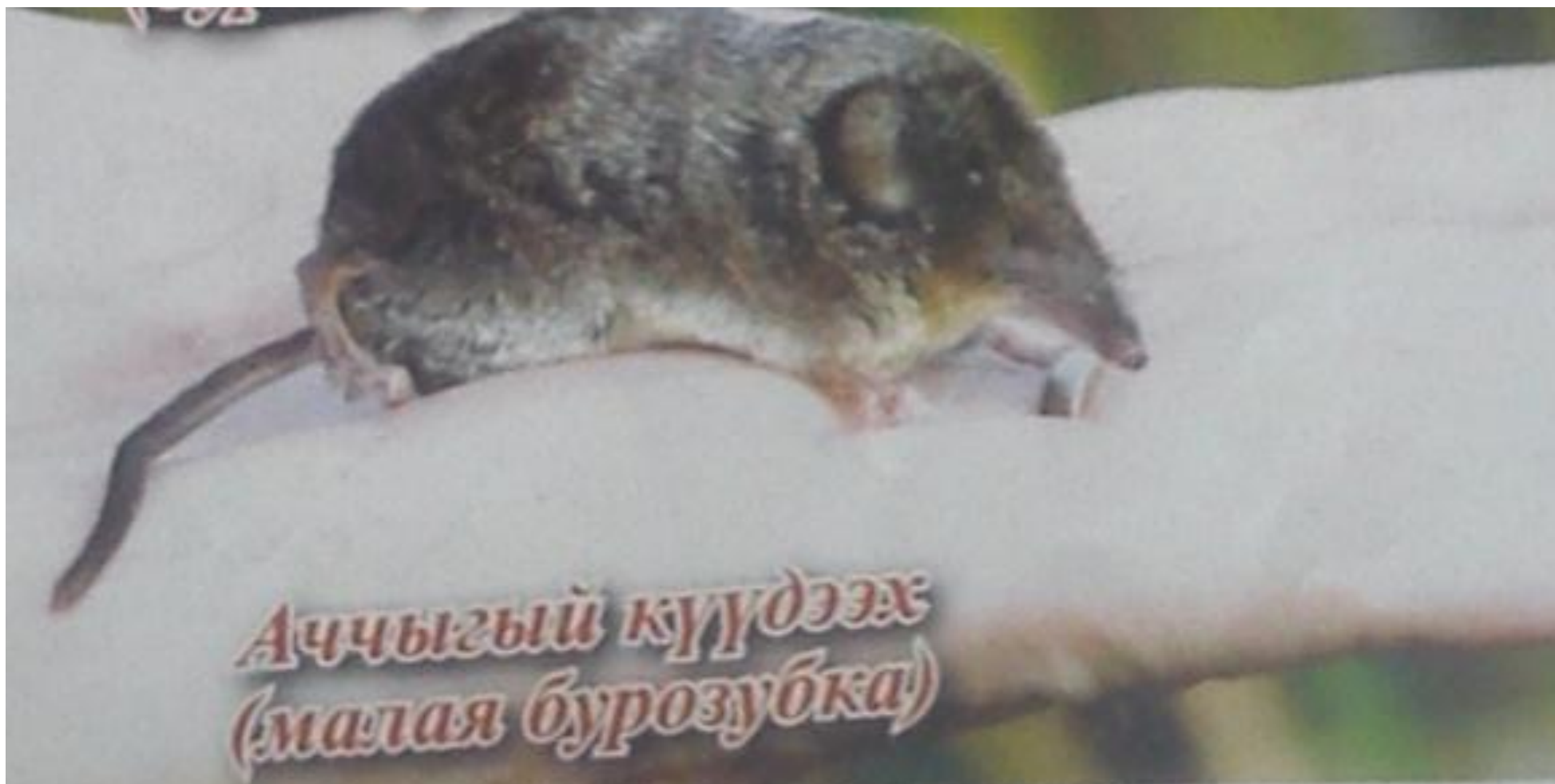
Аччыгый күүдээх (малая бурозубка)