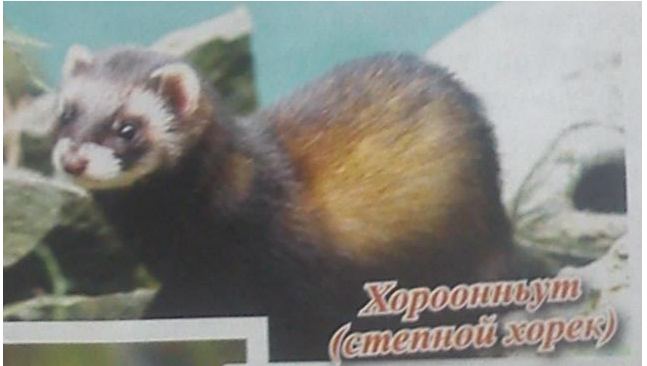
Хорооньют (стенной хорек)