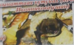
Иккиһикос саргы кыһата, кыһаттаас кутуйах (почица Иккиһикоса)ушан)