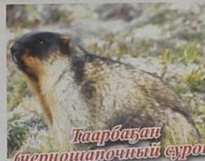
Таарбазан (черношапочный сурок)