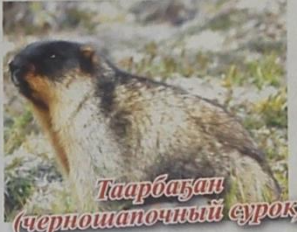
Таарбазан (черношапочный сурок)