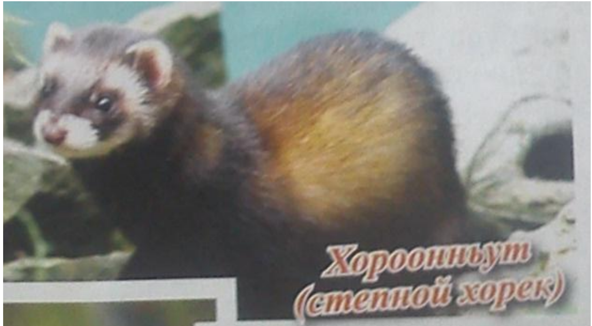
Хорооньнут (стенной хорек)