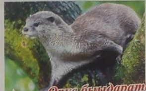
Өрүс бындарата (буукуни, итиэ, ытыы)