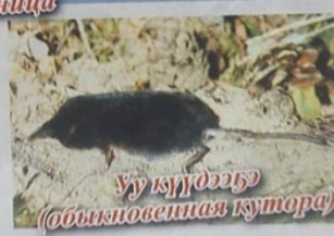
Уу күүдээтэ (обыкновенная кутора)