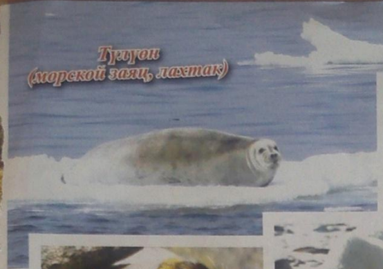
Тулгоон (морской заяц, ласетак)