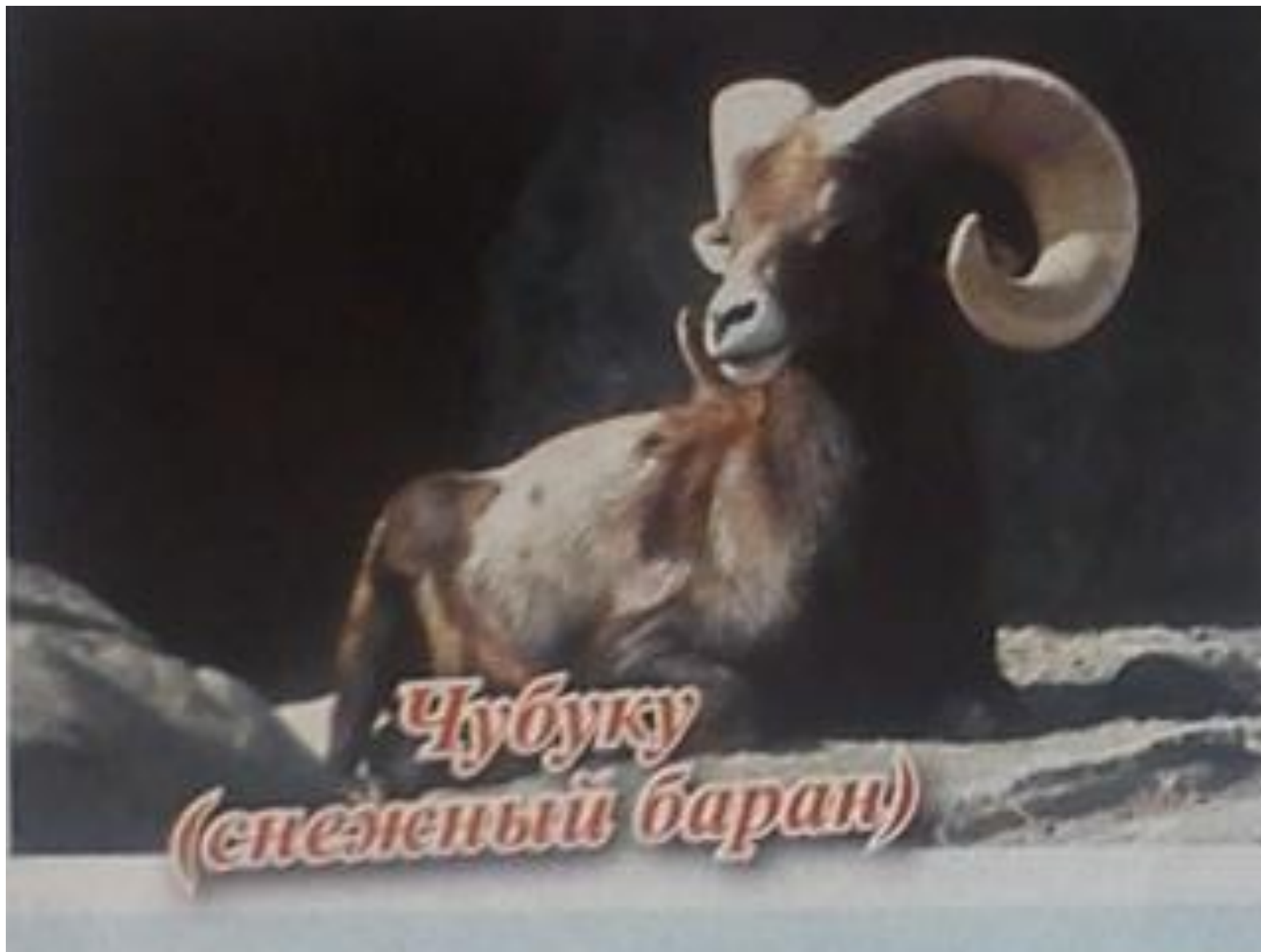
Чубуку (снежный баран)