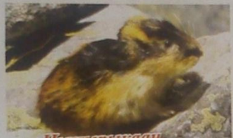
Чыгырсакаан, Амур чыгырыкаана (амурский лемминг)