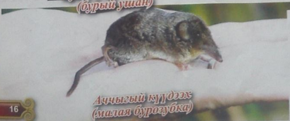
Аччыгыт күүдээтэ (малая бурозубка)