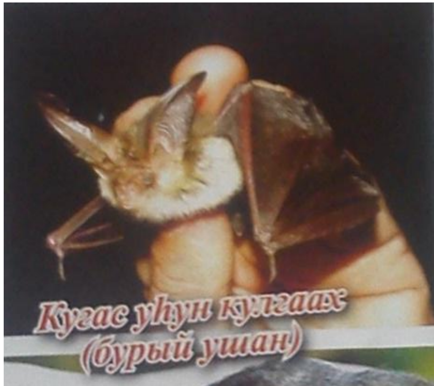
Кугас уһун кулгаах (бурый ушан)