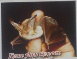
Кусас уһун кутэаах (бурый ушан)