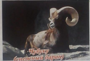
Чубуку (снежный баран)