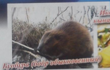
Буобура (обор обыкновенный)