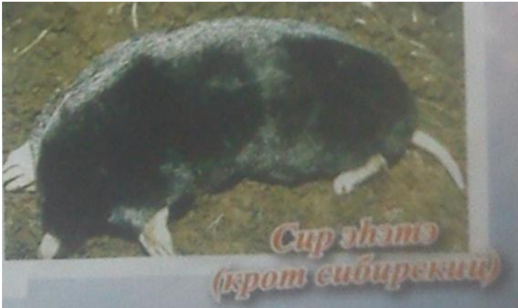
Сур элэнэ (крот сибирский)