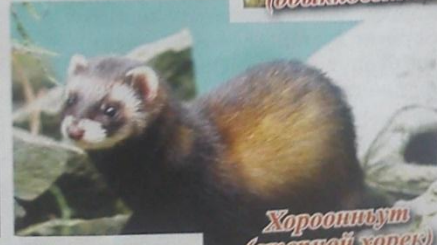
Хороһиһут (степной хорек)