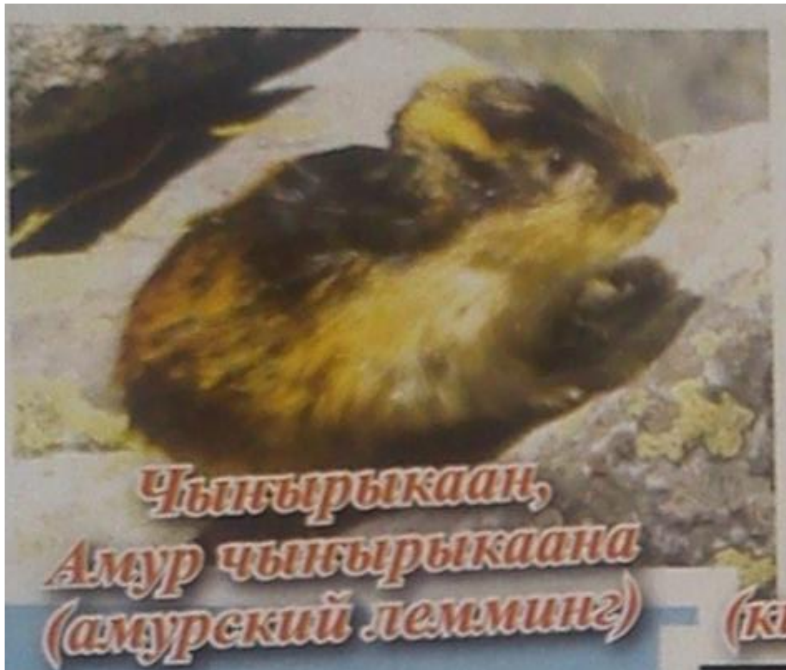
Чыгырыкаан, Амур чыгырыкаана (амурский лемминг)