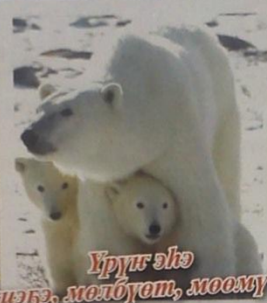
Үрүг элэ (кыбз, мелбуэт, моомучэ)