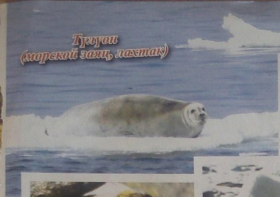
Тулгоон (морской заяц, ласетак)