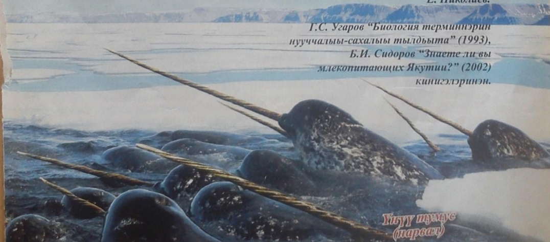
Үгүү туммас (морсат)

Б.И. Сидоров "Знаете ли вы млекопитающих Якутии?" (2002) книгэлэринэн.