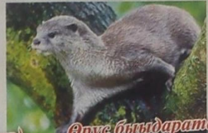
Өрүс бындарата (буукуни, итиэ, ытыы)