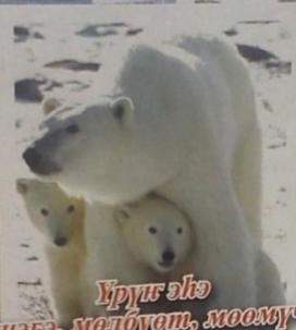
Үрүг элэ (кыбз, мелбуэт, моомучэ)