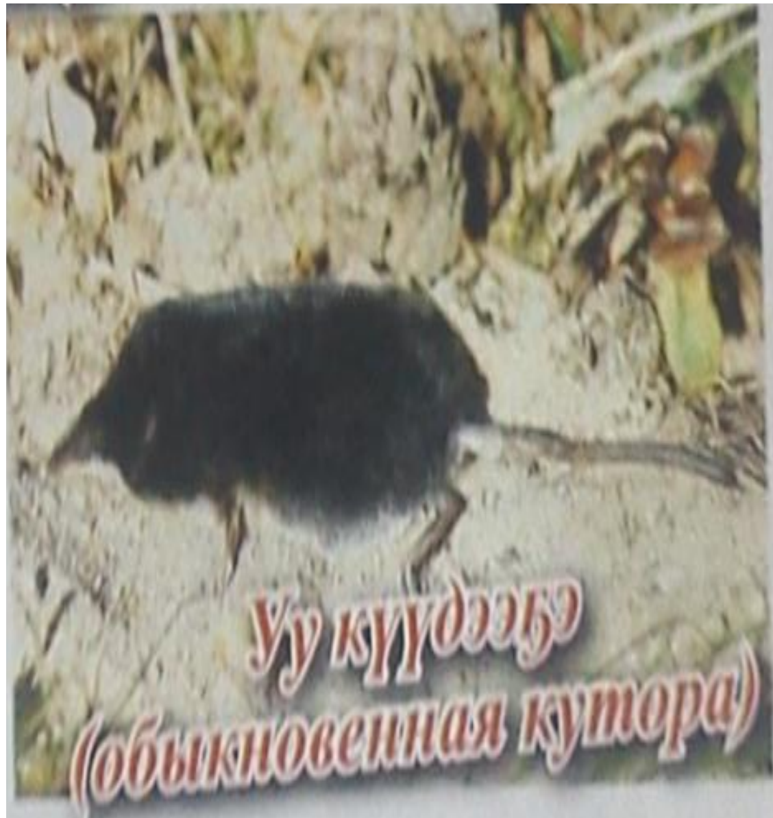
Уу куудзү (обыкновенная кутора)