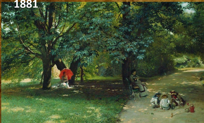
К. Маковский. В парке. 1881