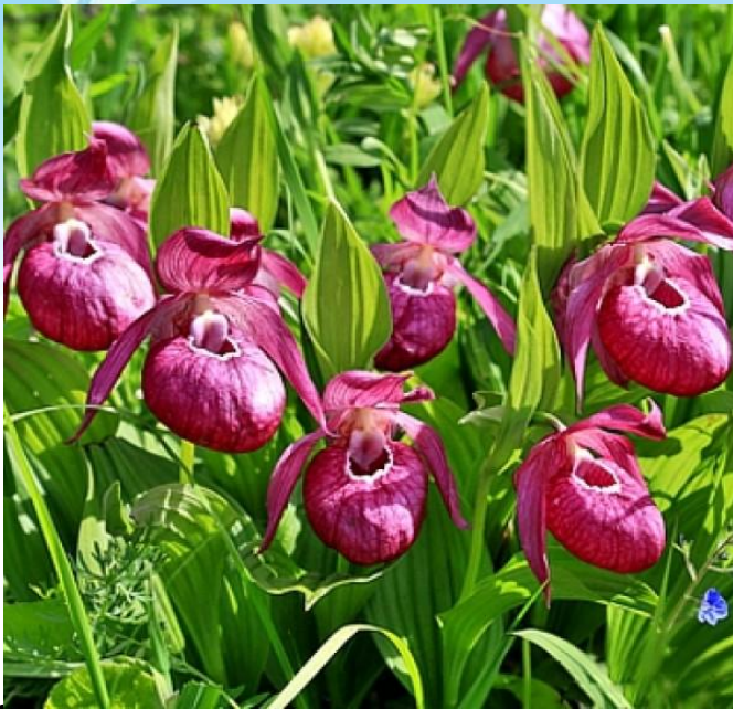
Венерин башмачок крупноцветковый Турчанинова