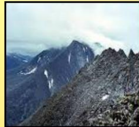
Г. Народная высота -1895м