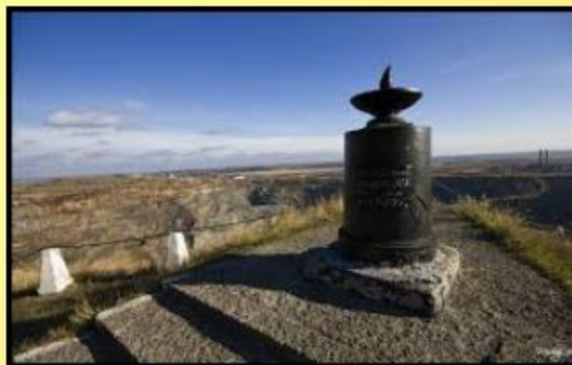
Граница между Европой и Азией