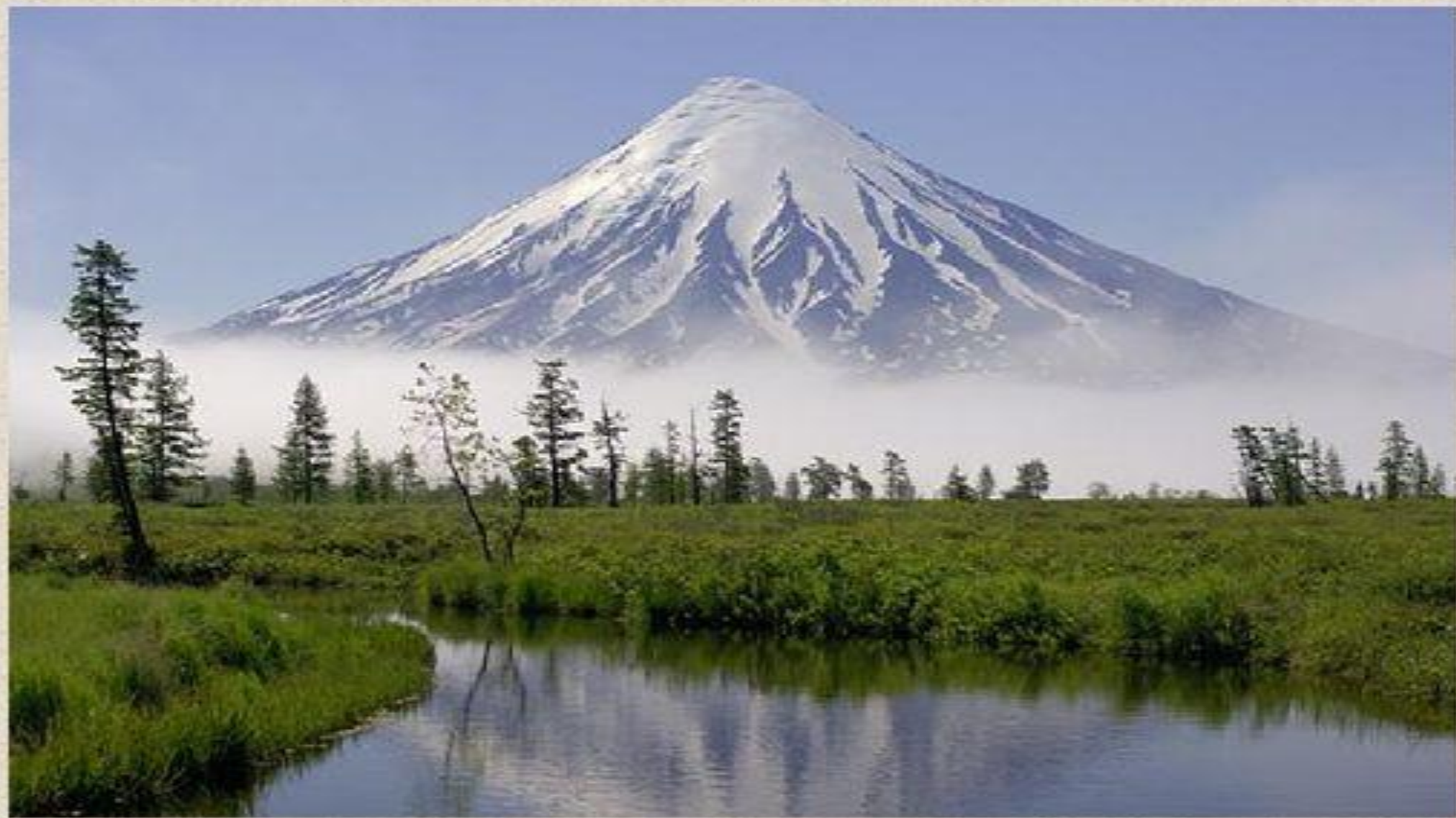
Знаменитый действующий вулкан Кроноцкая сопка