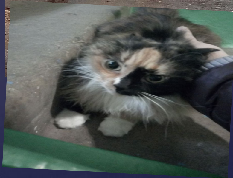
БЕЗДОМНЫЕ ЖИВОТНЫЕ НАШЕГО ДВОРА