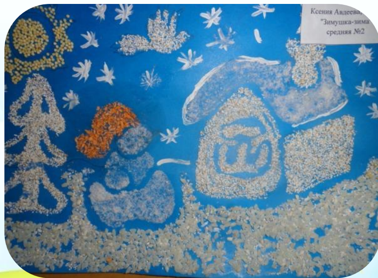
Ксения Андреева "Зимушка-зима" средняя №2