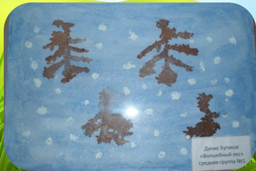
Денис Бутаков «Волшебный лес» средняя группа №1