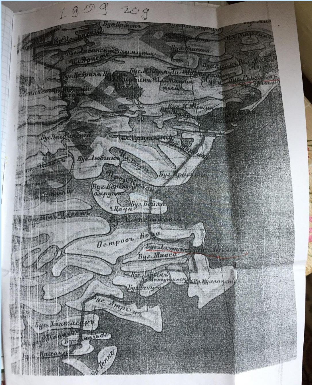
Лагань в составе Яндыко-Мочажного улуса Астраханской губернии. 1909 год.