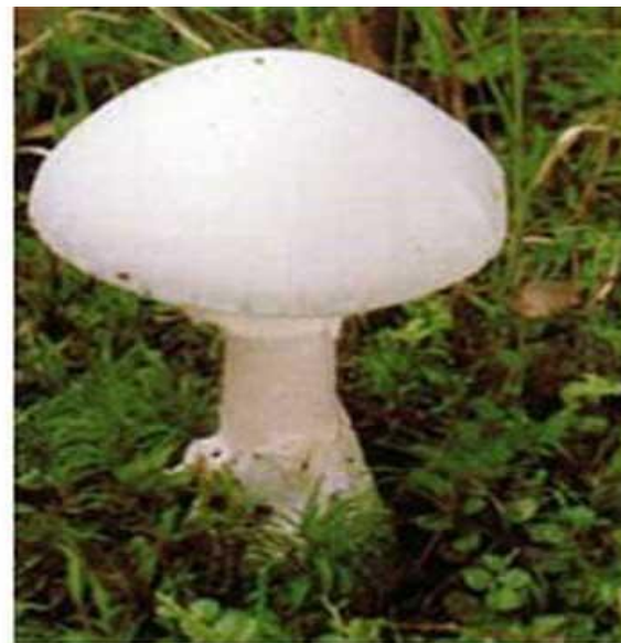
Молодая бледная поганка