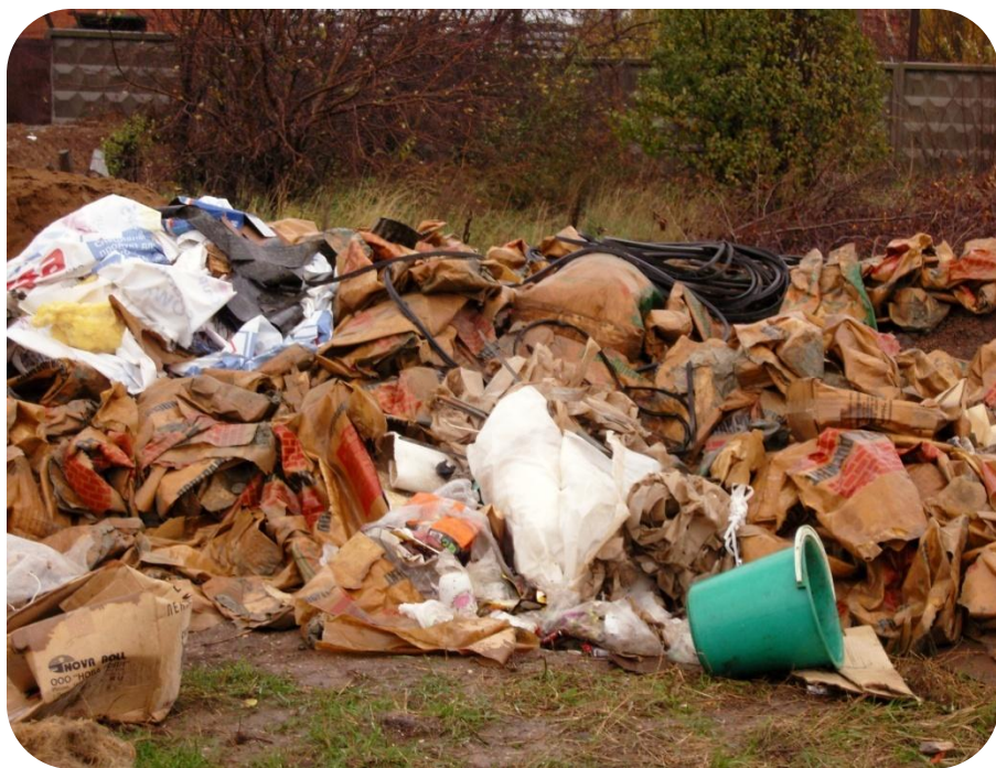
свалка строительного мусора дворе НЮР г.Чебоксары