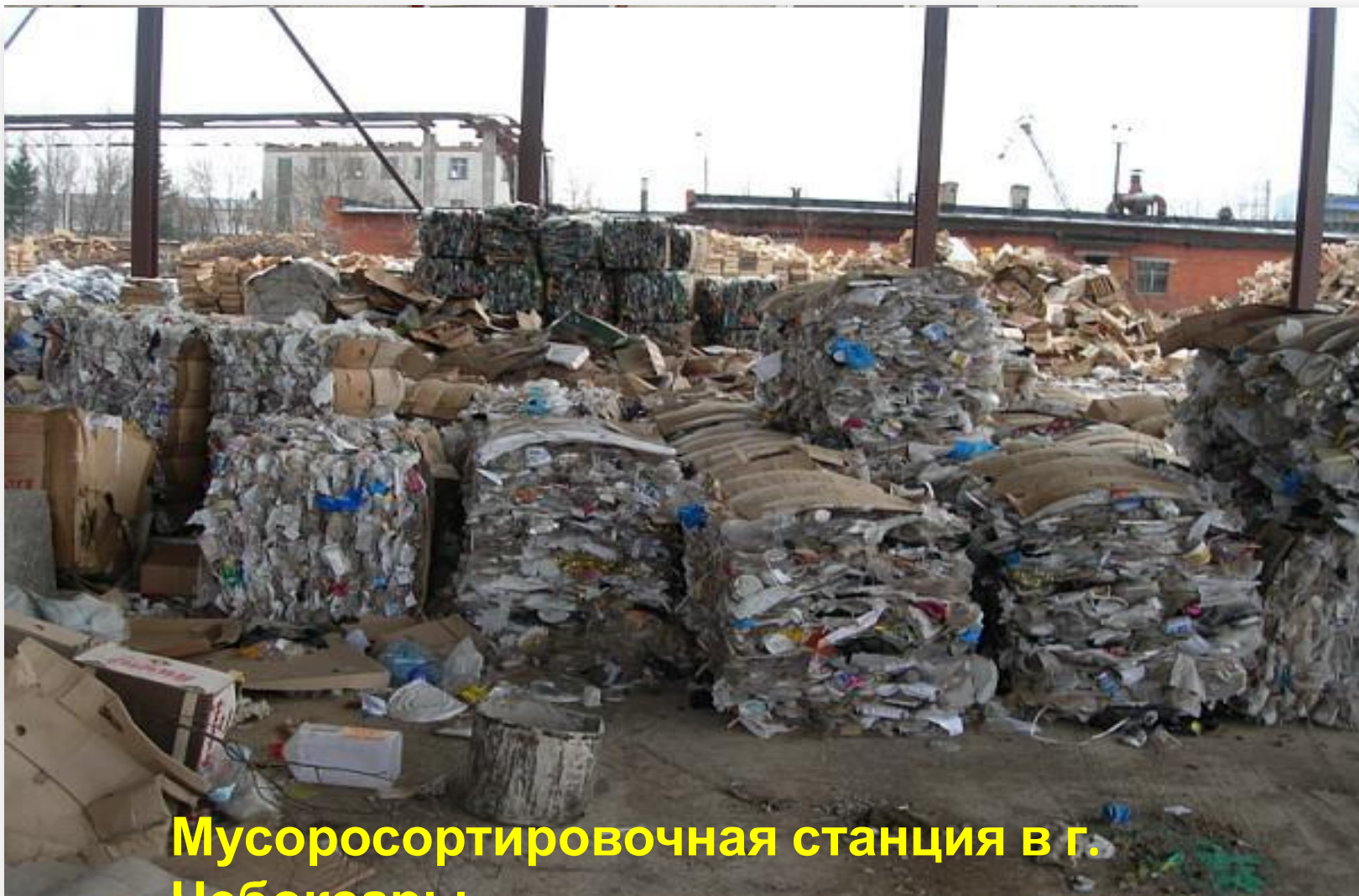
Мусоросортировочная станция в г. Чебоксары