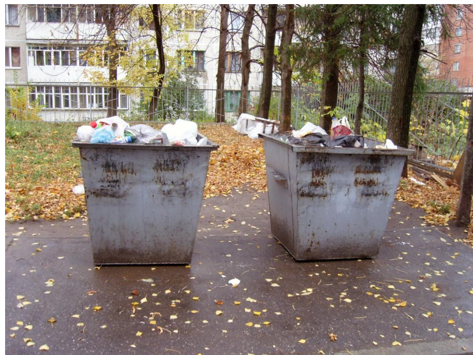
контейнеры ТБО во СЗР г.Чебоксары