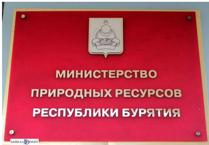
Министр природных ресурсов Республики Бурятия Сафьянов Юрий Павлович