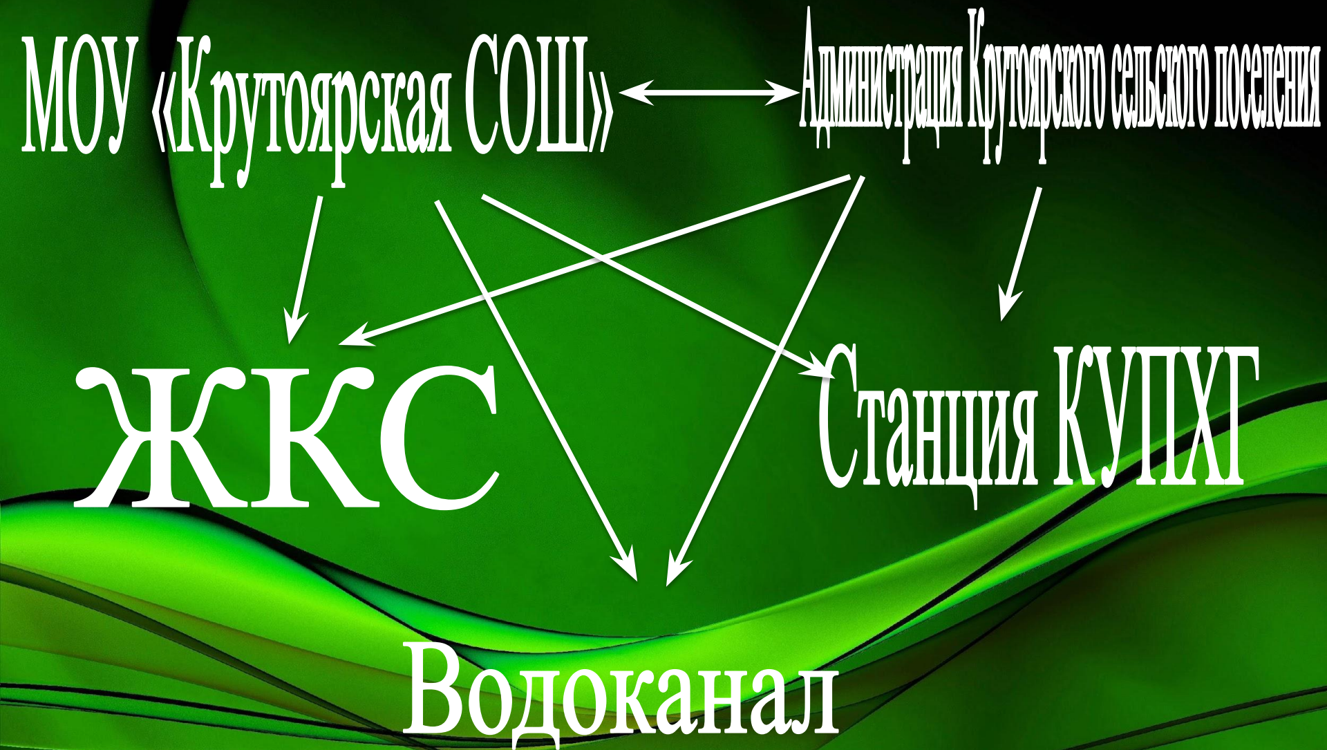
Схема взаимодействия структур по решению экологических проблем в поселке.