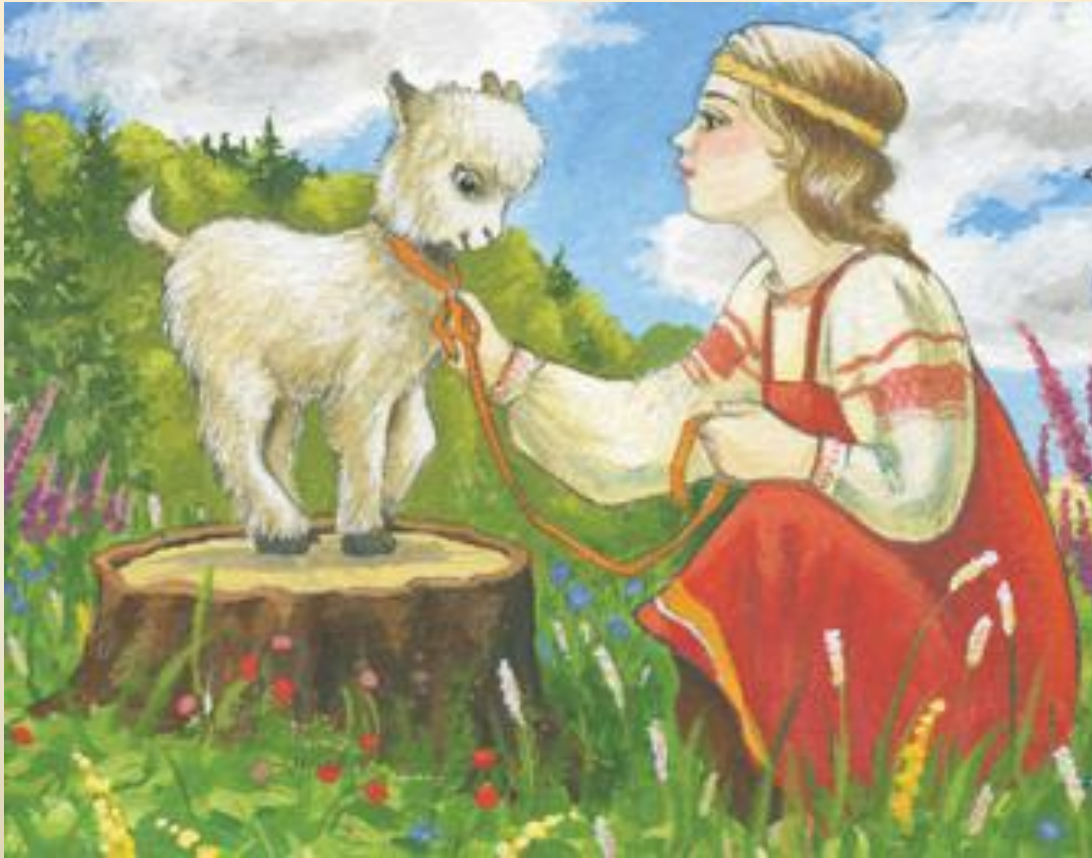
Сказка «Сестрица Алёнушка и братец Иванушка»

Быть может, сочинители этой сказки, пытались предостеречь людей не пить грязную воду, т.к. можно серьёзно заболеть. От животных человек может заразиться различными, в том числе и смертельно опасными инфекционными заболеваниями, одно из путей передачи инфекции через воду.