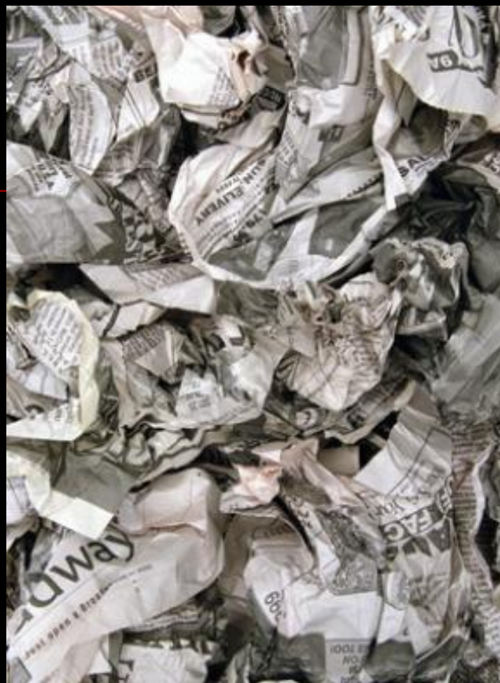
Разложение бумаги – 2 года