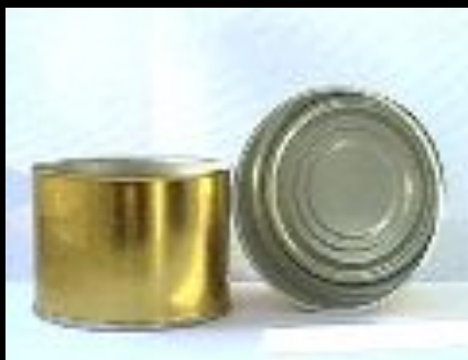
Разложение консервной банки – 90 лет