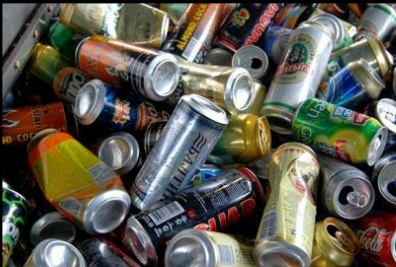
Разложение алюминиевых банок – 500 лет