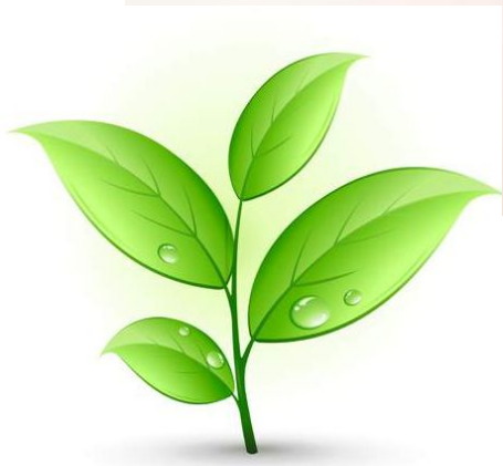
Рисунок 2-Экологическая стандартизация в РФ