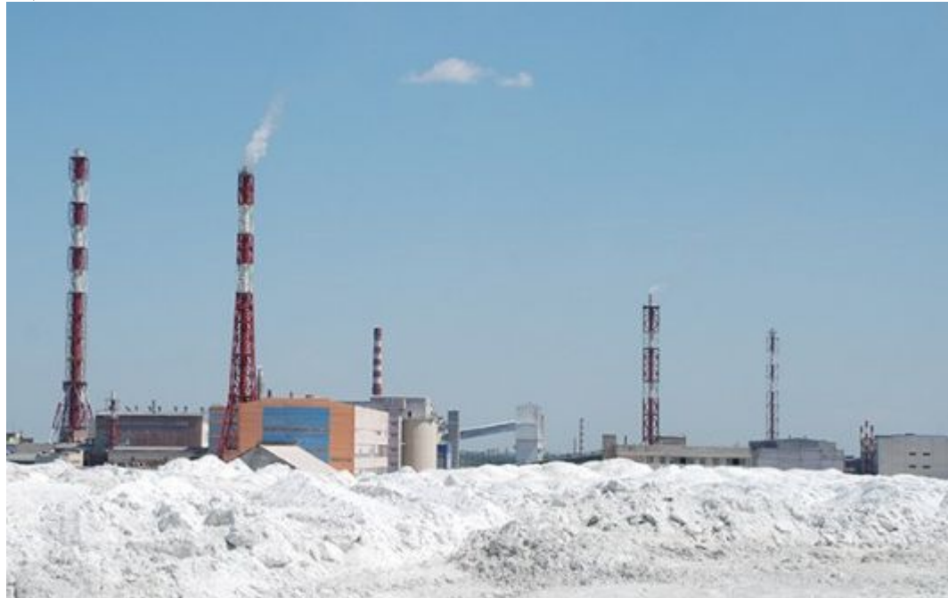
Рисунок 3- Накопленные отвалы фосфогипса на территории завода

В мире, в том числе и в России, проведен большой комплекс работ по изучению свойств фосфогипса (ФГ), технологий его переработки и направлений его использования в народном хозяйстве. Уровень использования фосфогипса в прошлые годы достигал порядка 2,5 млн. т/год, т.е. более 10 % годового выхода. Однако в настоящее время, из-за дороговизны энергоносителей, транспортных перевозок, сокращения объема строительства, потребление фосфогипса снизилось практически до 0,5 %.