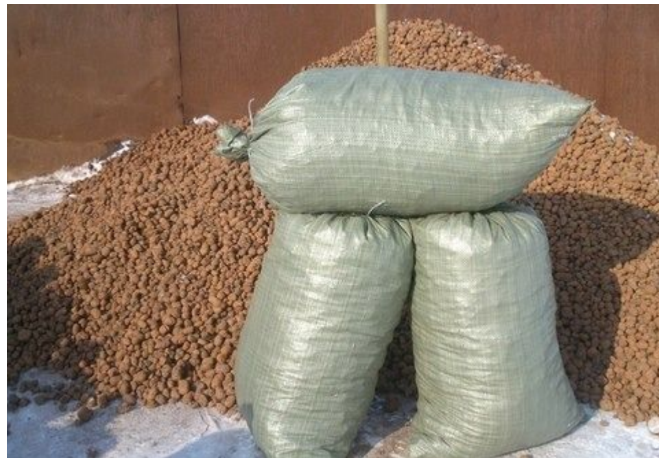
Рисунок 4- Керамзит

В связи с этим стоит вопрос утилизации отходов керамзита.