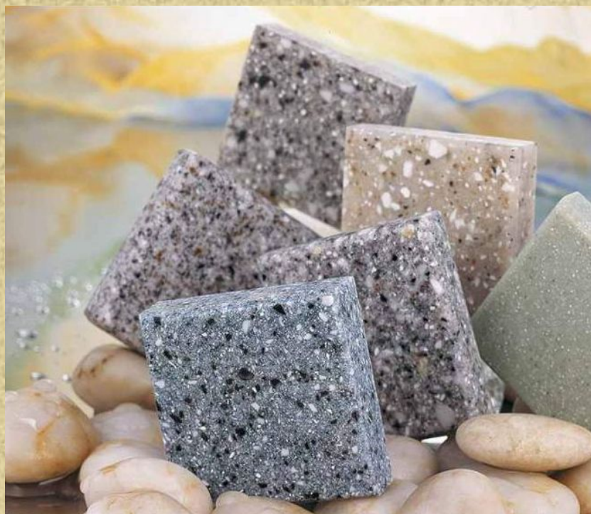
Рисунок 1-Образцы полимербетона.

Полимербетоны -это камневидные искусственные материалы, которые получают на основе стойких к химическим воздействиям наполнителей и заполнителей ,а также синтетических смол без использования воды и минеральных вяжущих [1].