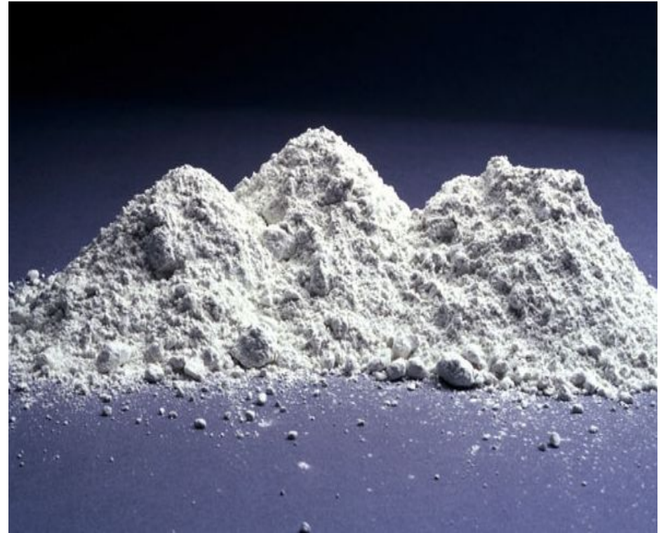
Рисунок 2-Отходы фосфогипса

Фосфогипс является многотоннажным отходом производства концентрированных простых и сложных фосфорных удобрений. На 1 тонну произведенной фосфорной кислоты образуется 3 т отходов или техногенных грунтов. Образование гипсосодержащего техногенного грунта связано не по причине отсталой технологии : этот традиционная технология, принятая во всем мире, просто на зарубежных предприятиях производства фосфорной кислоты имеются предприятия по переработке фосфогипса.