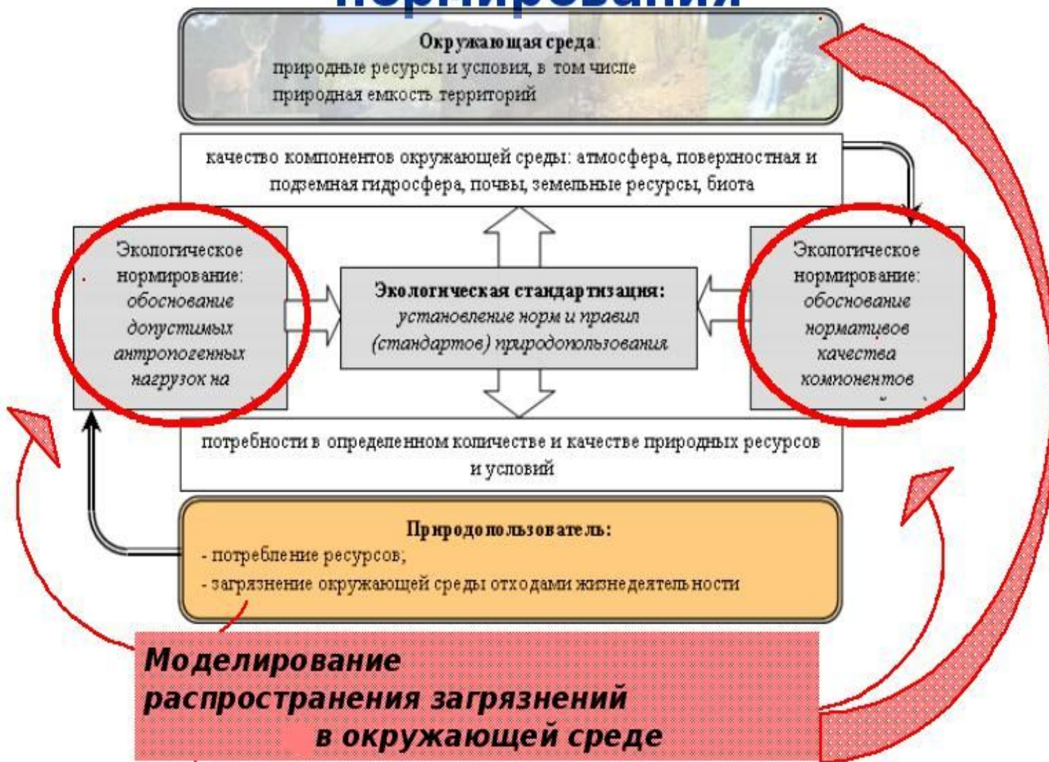
Рисунок 3- Система экологического нормирования