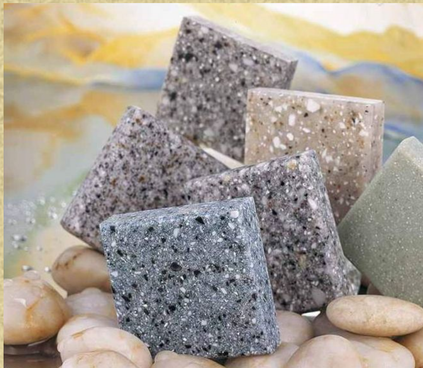
Рисунок 1-Образцы полимербетона.

Полимербетоны -это камневидные искусственные материалы, которые получают на основе стойких к химическим воздействиям наполнителей и заполнителей ,а также синтетических смол без использования воды и минеральных вяжущих [1].