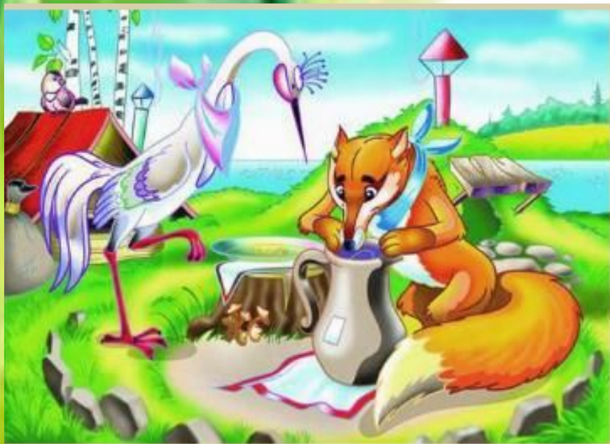
Сказка «Лиса и журавль»