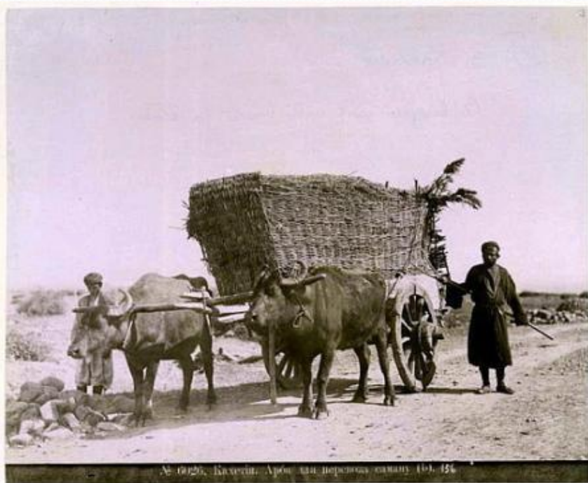
№ 0026, Кавказ. Арбуз на перевоза ослику 191. 154