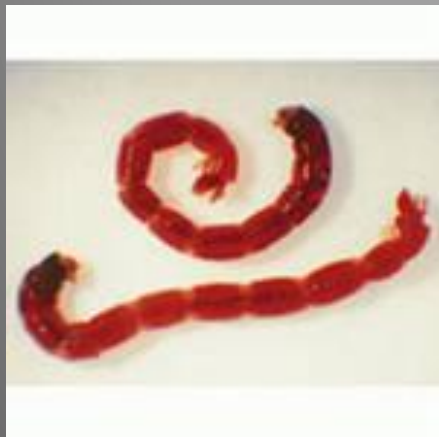
Личинки комаров мотыль