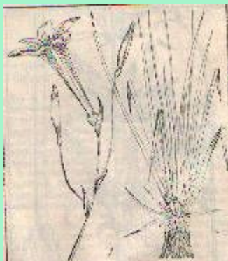
красноднев малый из семейства лилейных

гнездоцветка клубучковая из семейства орхидных