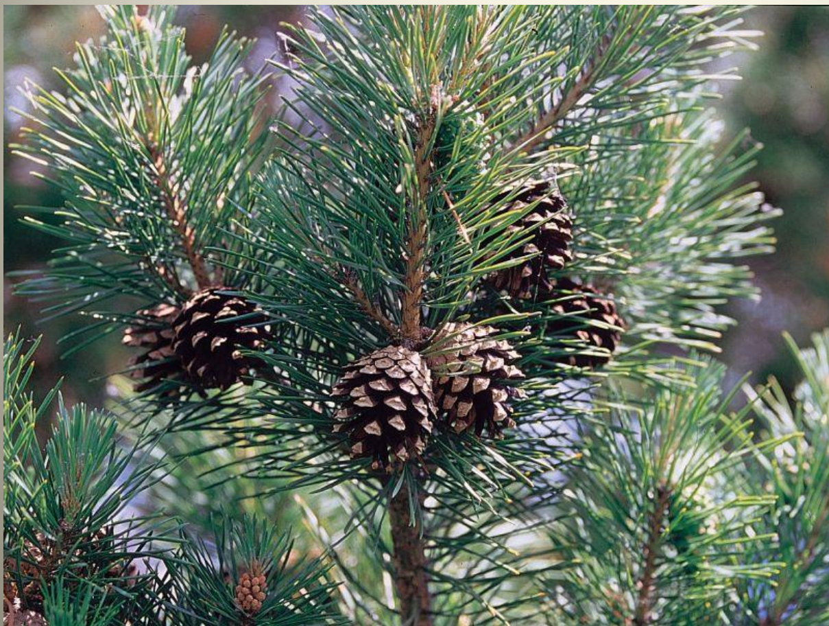
Сосна обыкновенная – ( Pinus sylvestris ).

Сосна обыкновенная может служить индикатором чистоты воздуха.