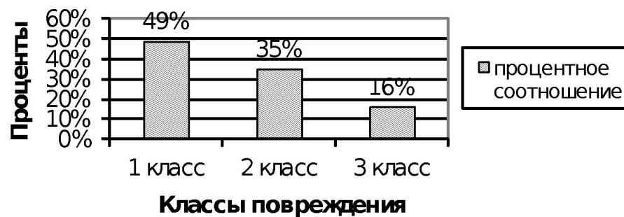
Среднее количество хвоинок по классам повреждения (Диаграмма №1) Участок 1

ГРЭС №5 – один из загрязнителей Шатурского воздуха