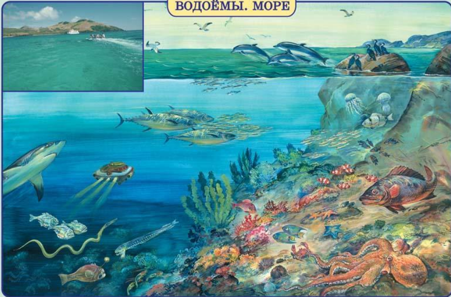
ОКРУЖАЮЩИЙ МИР. Начальная школа