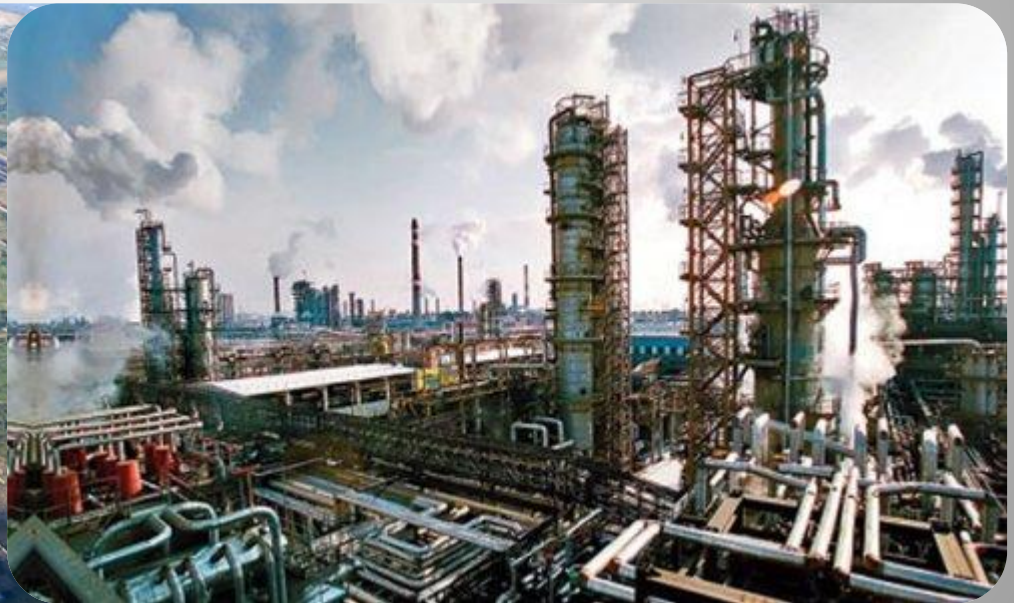
Нефтезавод в г. Омске