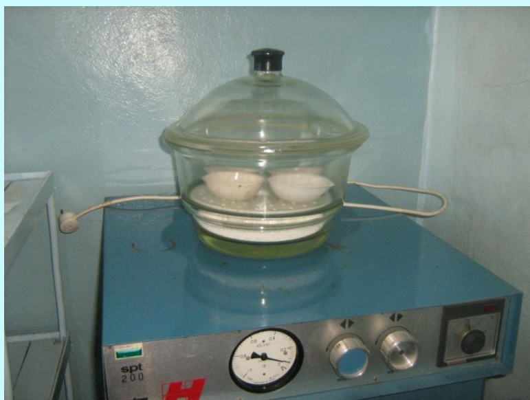
Сушильный шкаф SPT-200