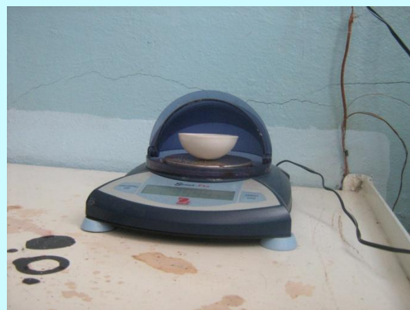
Весы электронные Scout