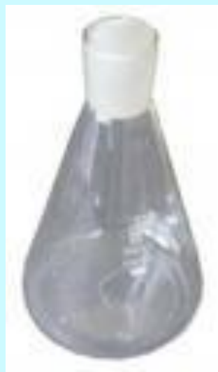
Колба с притертой пробкой