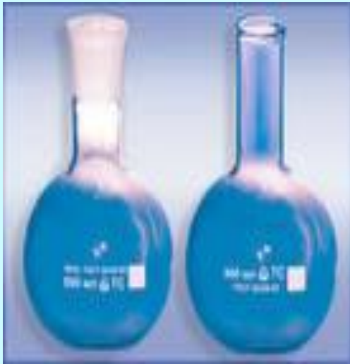
Колба с притертой пробкой