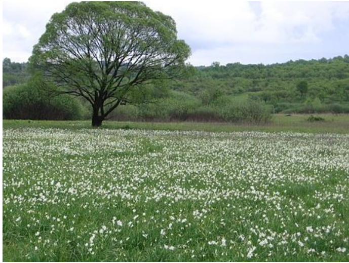
Цветущая Долина нарциссов