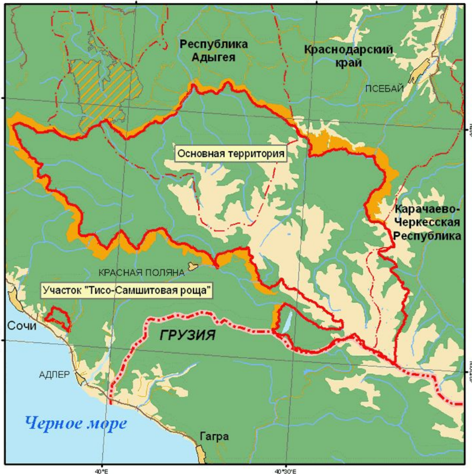
Кавказский биосферный резерват

Дата создания КГПБЗ является право- преемником Кавказского зубрового заповедника, учрежденного 12 мая 1924 года Декретом СНК СССР. Площадь запове- дника неоднократно изме- нялась ( в настоящее время составляет 280 335 га). Ряд участков в 50- х-60-х годах прошлого века изымался и передавался для лесопользования, скотоводства и туризма.