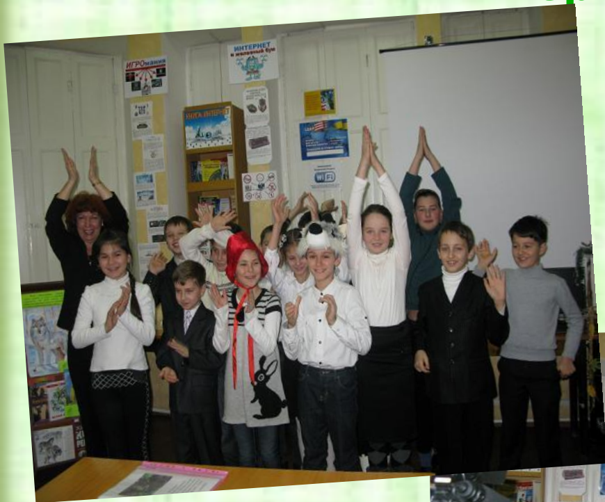
«Серая Шапочка и Красный волк»