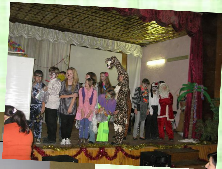
«Школьный Новый год на Мадагаскаре»