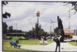
Луховицы. Памятник огурцу