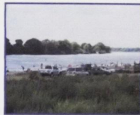
Просторы Оки п. Белоомут