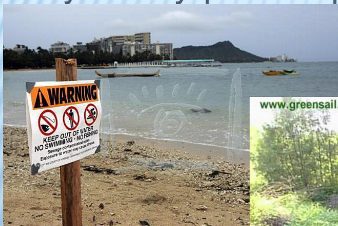
N007-2828 Противные дожди в городе Гонолулу (Honolulu) затопили канализационную систему, что способствовало загрязнению воды. На фото: пляж Вайкики (Waikiki Beach), Гавайские острова, 29 марта 2006.