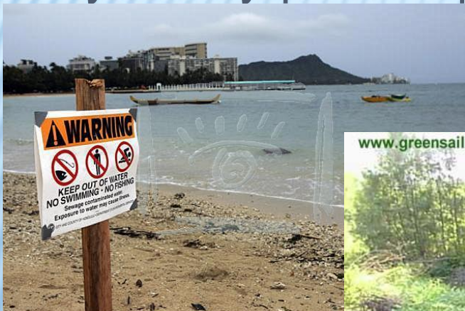
WWW.FOTOBANK.COM N007-2828 Getty News Противные дожди в городе Гонолулу (Honolulu) затопили канализационную систему, что способствовало загрязнению океана. На фото: пляж Вайкики (Waikiki Beach), Гавайские острова, 29 марта 2006.